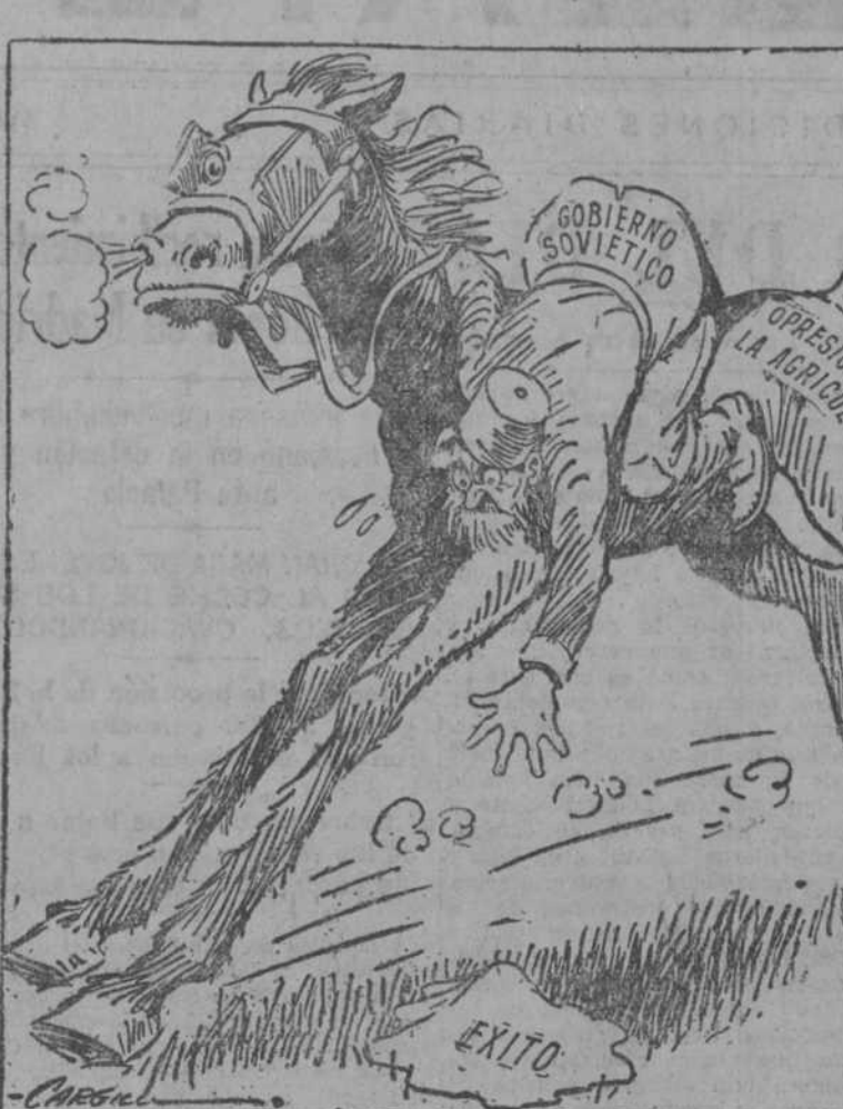
"Me parece que voy a tener que cambiar de caballo si quiero coger el pañuelo." ("Philadelphia Star".)