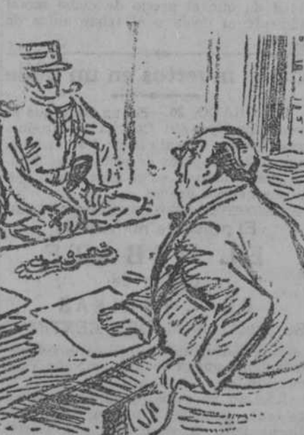
EL PASO POR FRANCIA