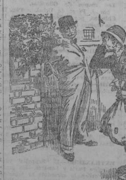
EL DEL BOMBIN (al cartero).—¿A qué hora recoge usted de este buzón?