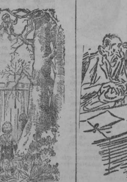
LA RAPIDEZ DEL PROCEDIMIENTO