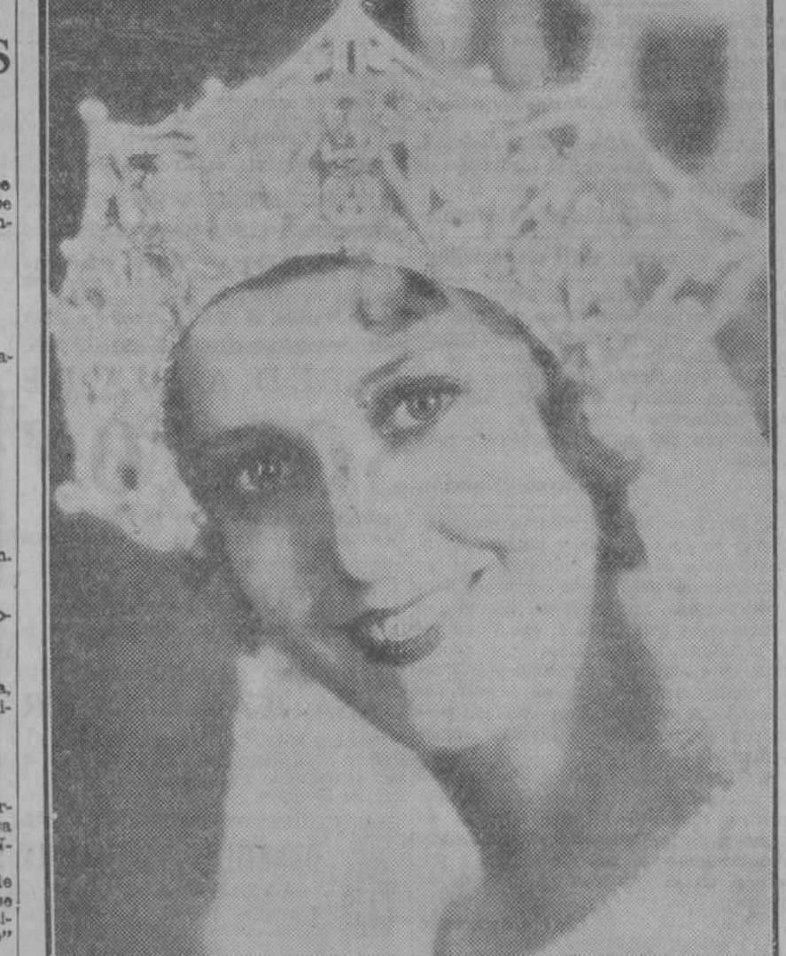
Jeannette Mac Donald, la bellísima artista protagonista de "El desfile del amor" que tan ruidoso éxito ha obtenido en el Callao

¡EL EXITO DE LOS EXITOS! Todos los días en el aristocrático