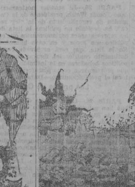
ERROR DE CALCULO