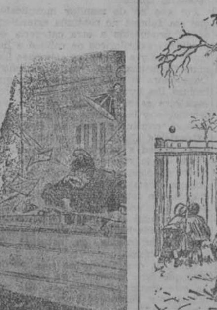
EL DEL ARBOL.—¿Qué malo es este equipo!