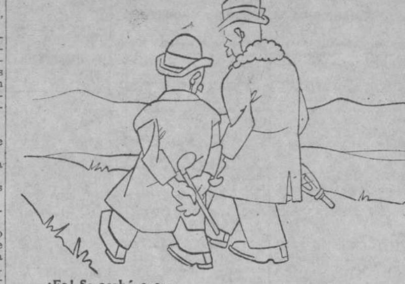
—¡Ea! Se acabó enero. —¡Sí; ahora viene Marzo.