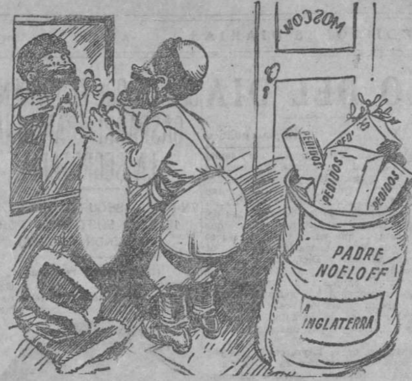
CON ESTE DISFRAZ, YA NO ME VIGILAN