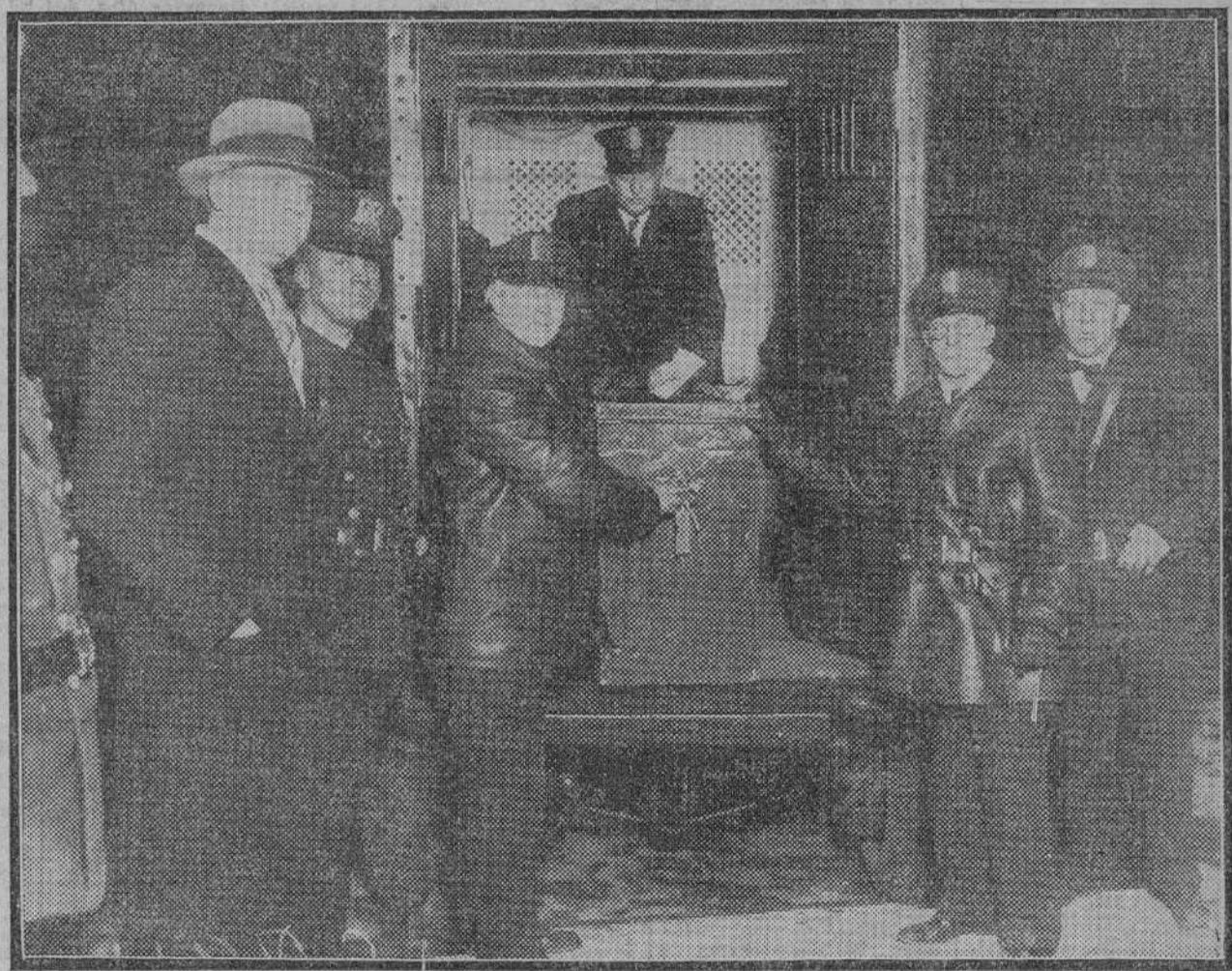
No siempre ocurren cosas graves en Chicago cuando se traslada dinero de un Banco a otro. En la "foto" se ve una "cajita" que contiene más de un millón de dólares, y que fué trasladada sin contratiempo.