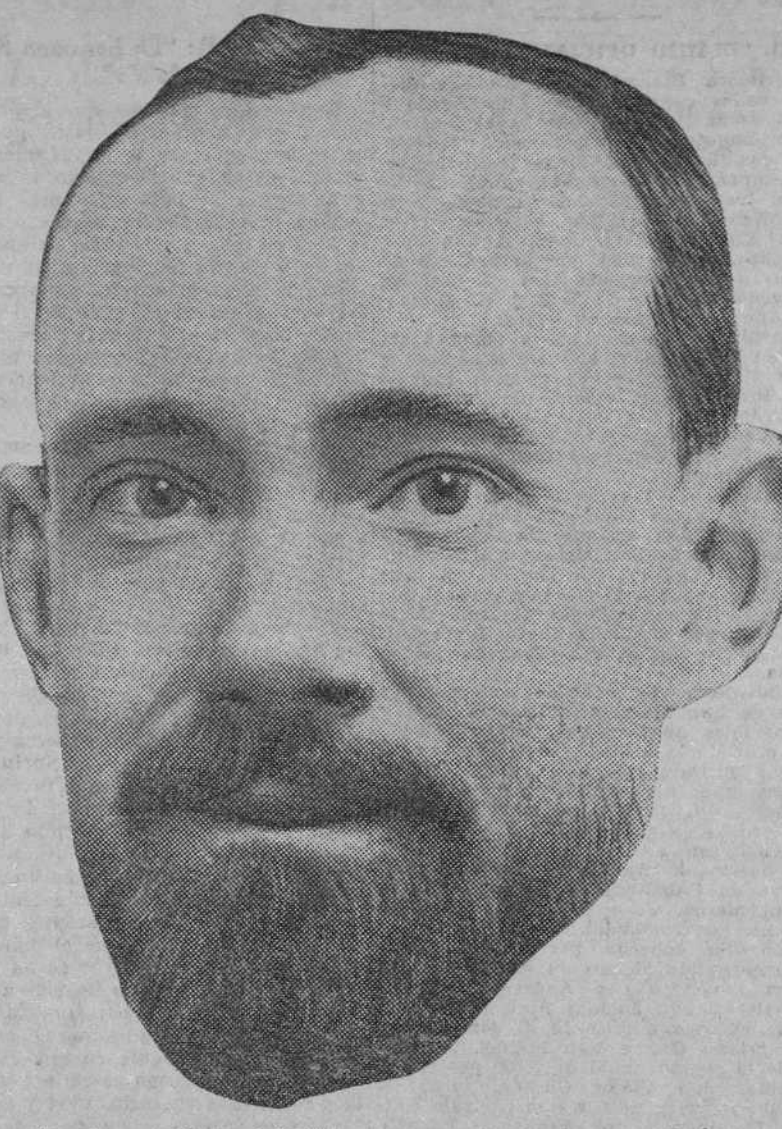
Sir George Hubert Wilkins, que en las regiones antárticas ha descubierto tierras hasta ahora desconocidas

Hace poco más de tres meses salió de Nueva York en pos de nuevas aventuras en las regiones polares del Sur el intrépido explorador y aviador Wilkins. Esperaba entonces poder descubrir a lo menos dos mil millas de costa al Occidente de la Tierra de Graham, para después haber completado su labor geográfica, encontrar un punto donde establecer una nueva estación meteorológica. No sabemos aún si las nuevas tierras descubiertas son las pretendidas por Wilkins. Pero de todos modos, el éxito lo acompañó hasta ahora su aventurada excursión. Wilkins es hoy día una figura de relieve universal. Su heroísmo fué consagrado en la Guerra Europea, y sus méritos como aviador y explorador en el temerario vuelo que realizó en 1926 sobre el Polo Norte, y en el que dos años más tarde hizo también en las regiones antárticas, donde descubrió seis islas desconocidas.