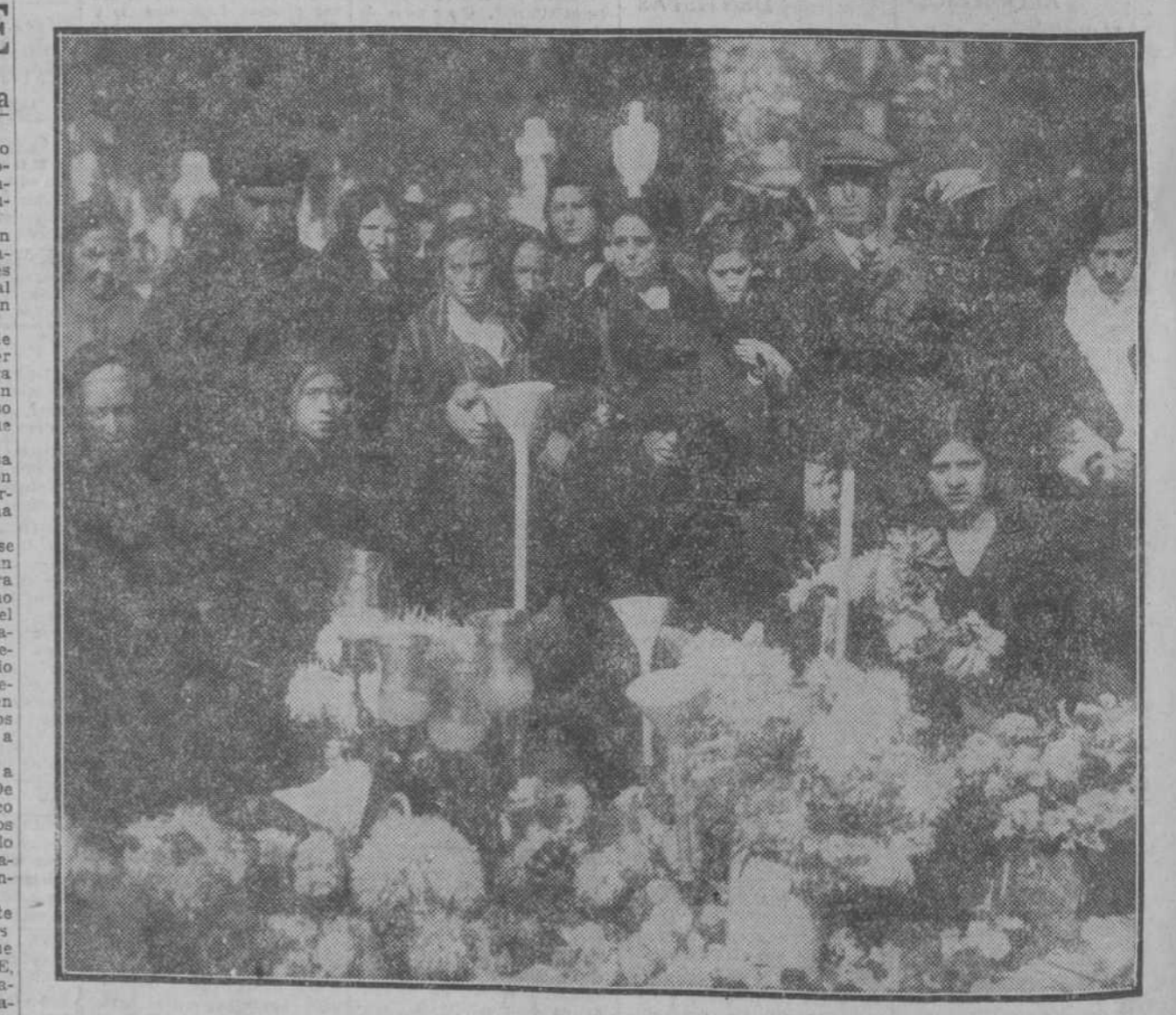
Familiares de las víctimas del incendio de Novedades, cuyas tumbas han cubierto de flores