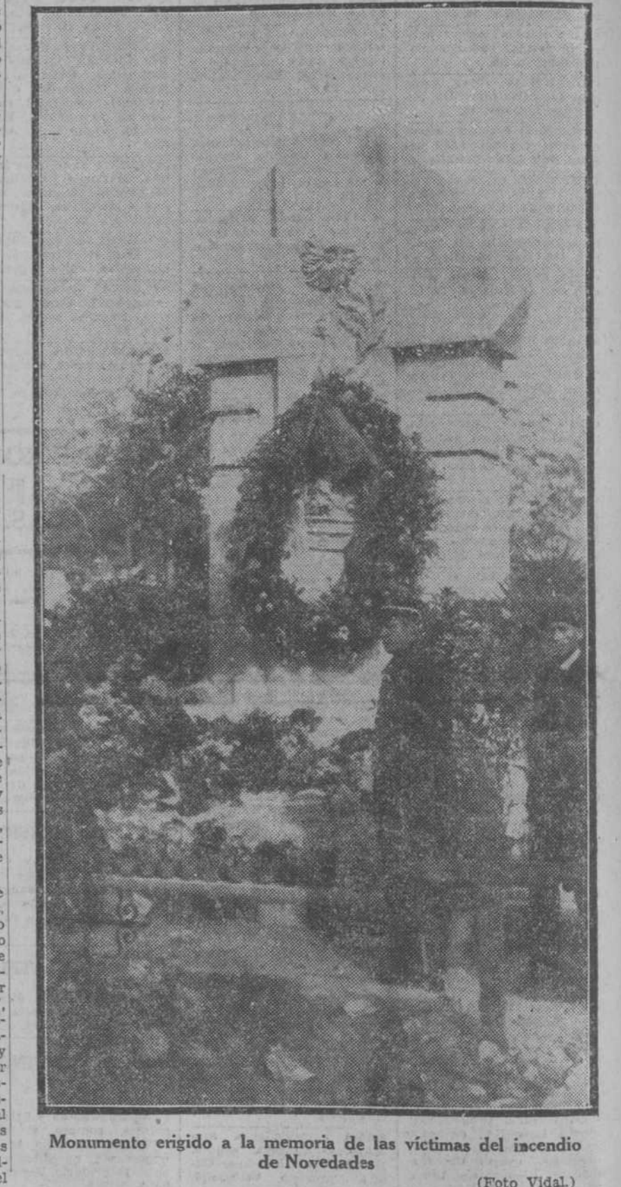
Monumento erigido a la memoria de las víctimas del incendio de Novedades