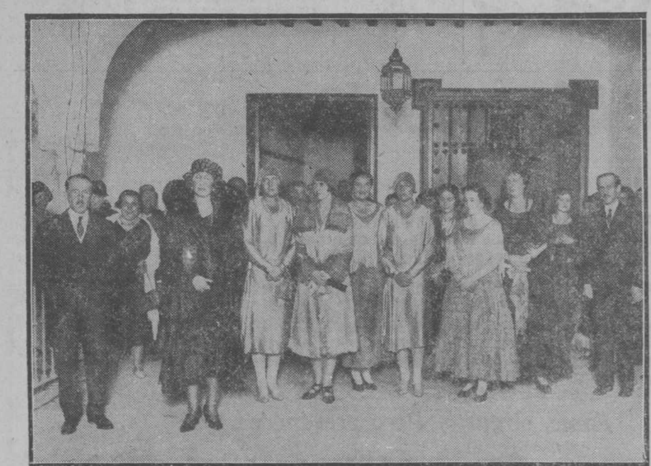
Su majestad la Reina y las infantas doña Beatriz y doña Cristina, acompañadas de la infanta doña María Luisa y sus augustas hijas, durante la fiesta andaluza celebrada en el pabellón de Agricultura de la Exposición Iberoamericana a beneficio de la Cruz Roja