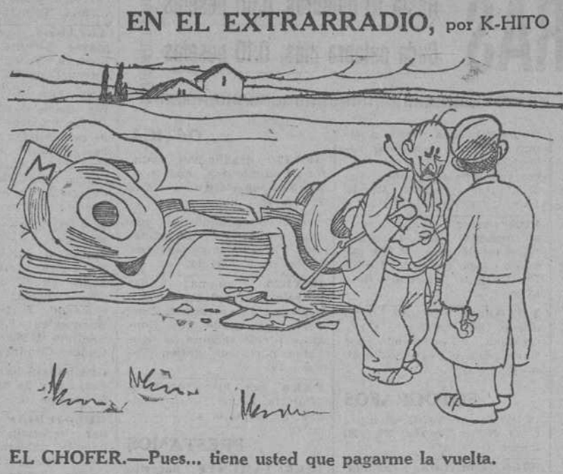
EL CHOFER.—Pues... tiene usted que pagarme la vuelta.

El ritmo lento y noble, pesa la influencia atávica de muchas generaciones de finetes señoriles que nunca tuvieron prisa para llegar y que se recreaban en la elegancia de cada paso, sin preocuparse con impaciencia del siguiente. Es el caballo del camino, no de la meta o la llegada. Se ve en su estampa señorial que no se considera él un "medio", sino un "fin"; no una herramienta de trabajo, sino un adorno y una gracia de la vida. Hasta cuando lleva a un aporador a su cortijo, parece que con pudor de aristócrata venido a menos quiere disimular el fin utilitario de su marcha y caminar con noble abandono, como si llevara a un rey moro a dar un paseo, bello e inútil, bajo el sol. Por eso la feria andaluza no puede marchar más que al paso del caballo de la tierra, porque es el paso de Andalucía: paso señorial, más preocupado de moverse con gracia que de llegar con presteza.