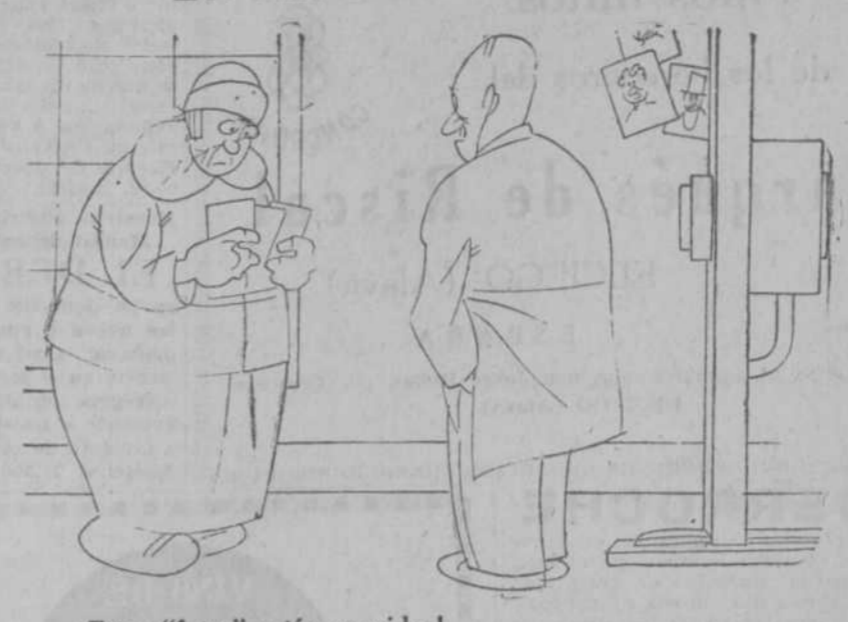
—¡Estas "fotos" están movidas! —No le extrañe a la señora... Los fenómenos sísmicos de estos días.