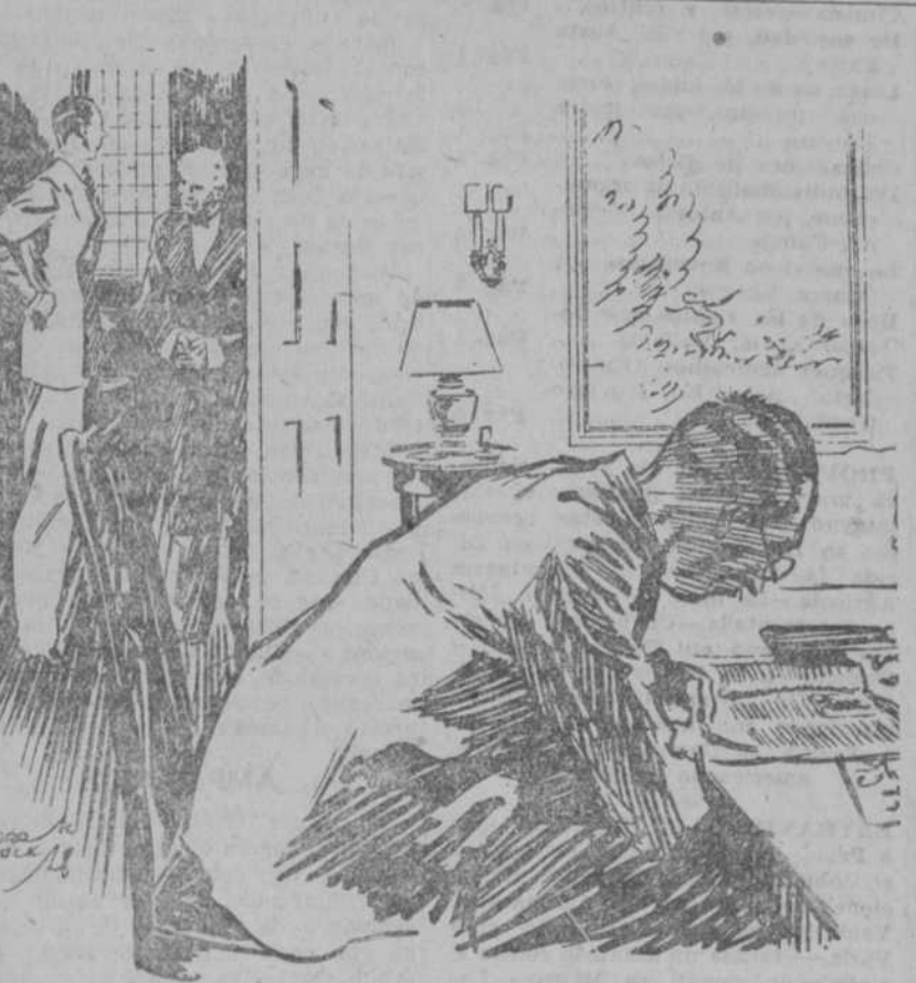
EL JOVEN DOCTOR.—¿Es verdad que hay un cliente en la sala de espera? EL CRIADO.—No, señor. Ese caballero viene una vez a la semana a leer esa novela por entregas.