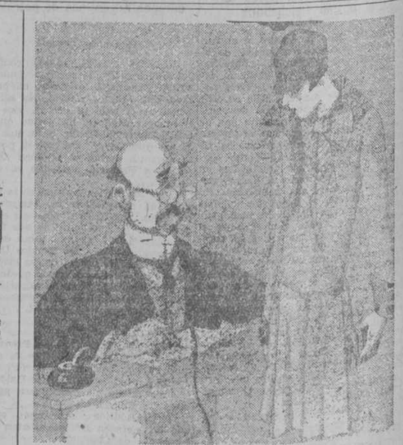
—¿Qué edad tiene usted, señorita? —...Veintinueve años. —¿Y cuántos meses? —Cuarenta y tres.