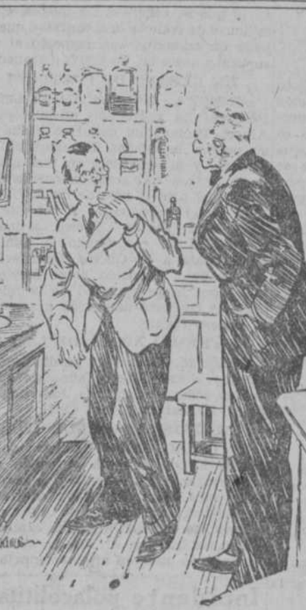
EL FARMACEUTICO.—¿Le diste mi cuenta a la señora de Limp? EL DEPENDIENTE.—¿Su cuenta? Pero si yo creí que era una receta..., ¡y la he llevado ya el jarabe!