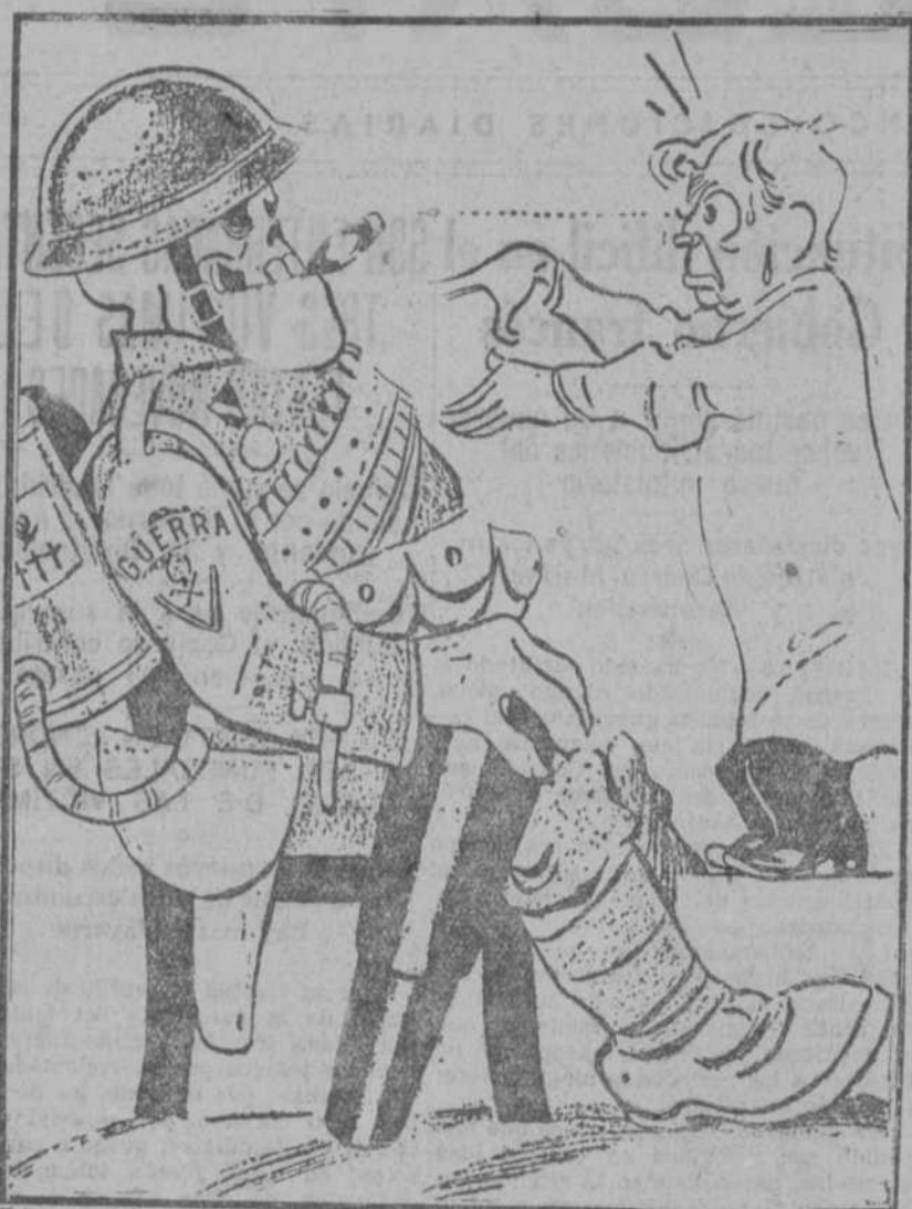
HIPNOTISMO EN PARIS.—KELLOGG: Usted ha sido prohibida. Usted está desde ahora fuera de la ley. Usted ya no existe. ("Izvestia", Moscú.)