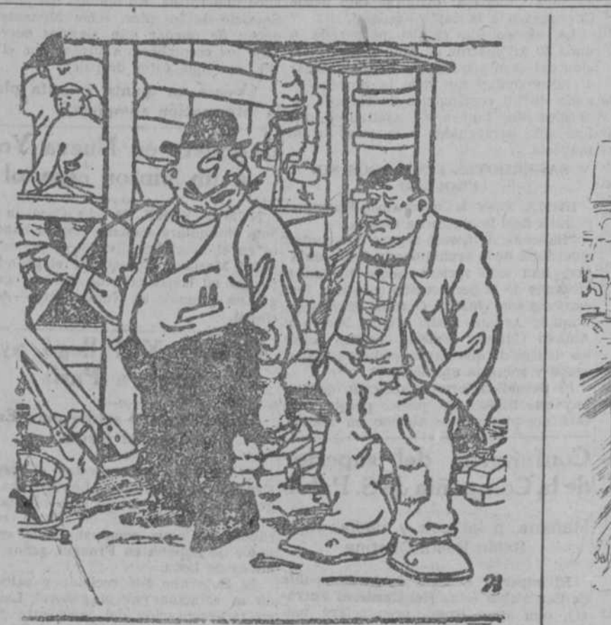
EL CAPATAZ.—Ese hombre que ve usted ahí trabaja el doble que usted. EL TRABAJADOR HOLGAZAN.—Y ya se lo he dicho yo a él..., pero no se corrige.