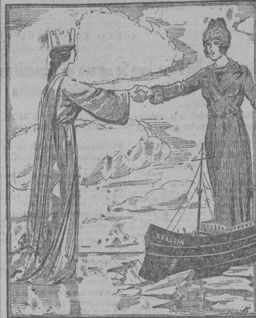
El rompimiento "Krasin" ha roto el hielo entre Italia y Rusia