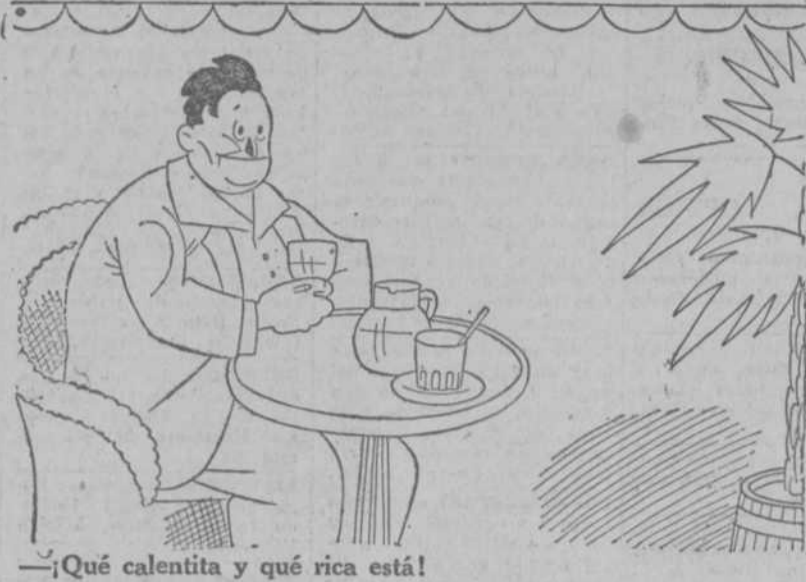
—¡Qué calentita y qué rica está!