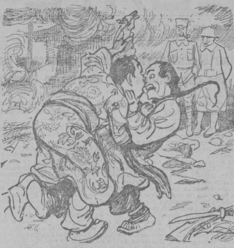
ASIA PARA LOS ASIATICOS (Kladderatsch, Berlín.)