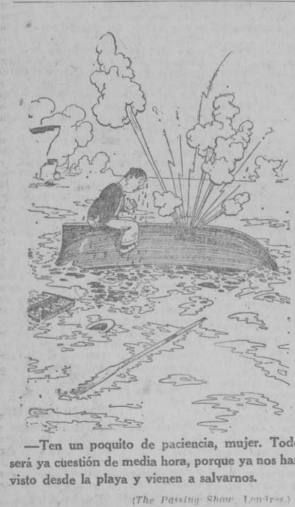
—Ten un poquito de paciencia, mujer. Todo será ya cuestión de media hora, porque ya nos han visto desde la playa y vienen a salvarnos.