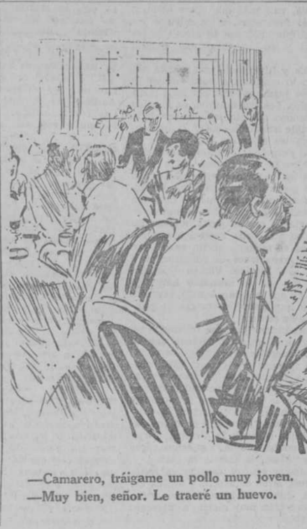
—Camarero, tráigame un pollo muy joven. —Muy bien, señor. Le traeré un huevo. (The Passing Show, Londres.)