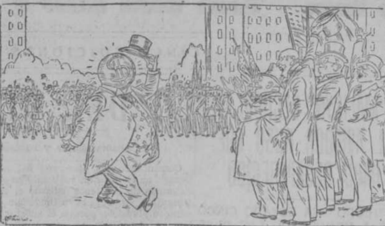
EL DOLAR.—Cualquiera que resulte triunfante, el verdadero presidente será yo.