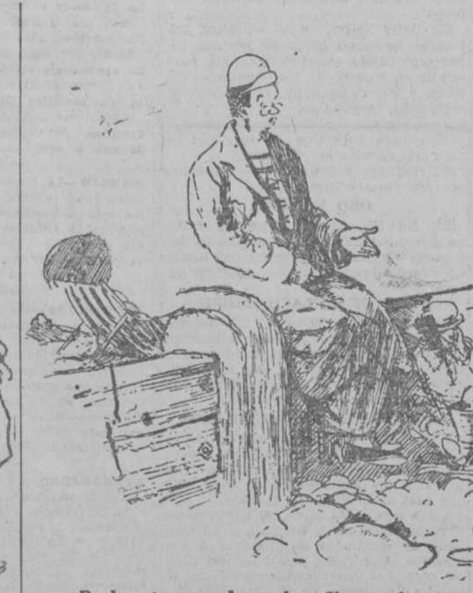
—Realmente, es mala sombra. Siempre hemos tomado unas habitaciones y comíamos por nuestra cuenta, y este año, que se me ha ocurrido pagar un tanto por cabeza, se ponen los dos niños malos de las muelas.