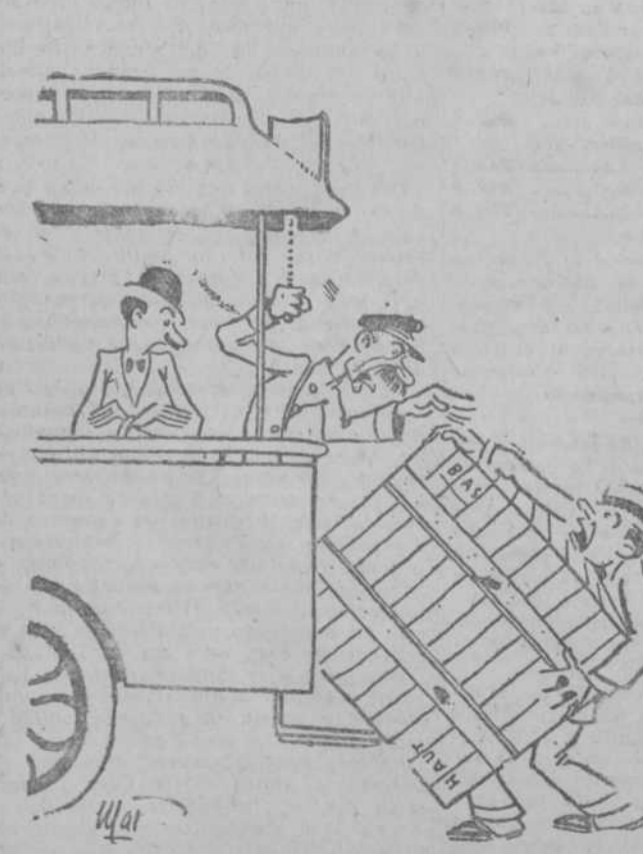
—Pero, hombre! ¿Qué inconveniente hay, si está vacío?