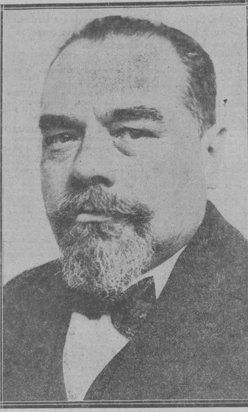
Monsieur Georges Lemarchand, elegido alcalde de París.