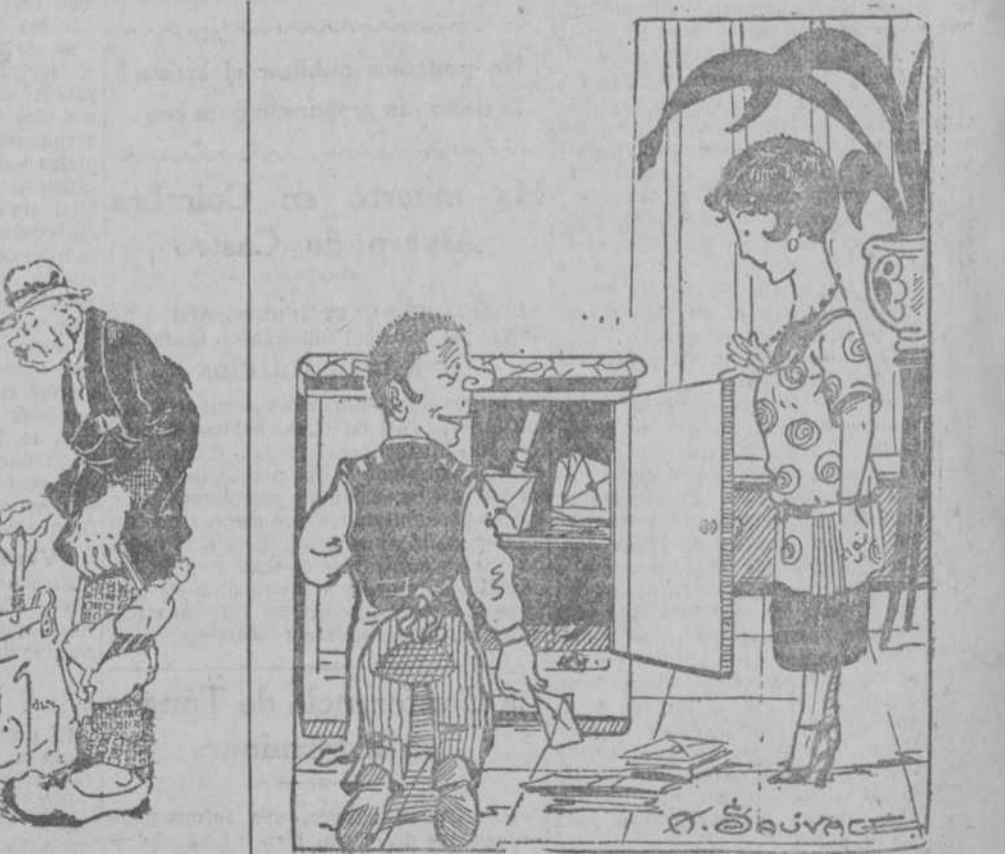
—¿Qué hace usted metiendo los periódicos y las cartas en la nevera? —Es que el señorito no quiere más que noticias frescas. (Pete-Mele, Paris.)