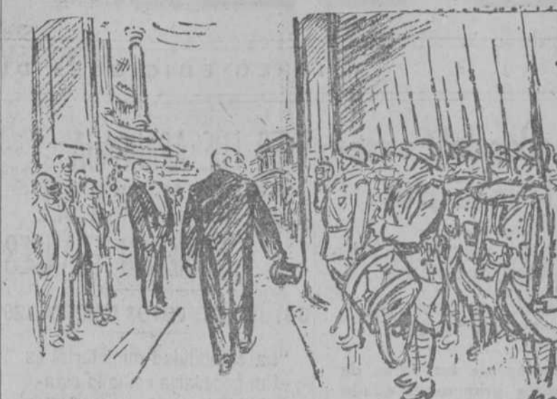
"No olvidemos que el bolchevismo y el socialismo tienen los mismos fines."—BLUM.

Ave. César Bouisson: los que tus correligionarios quieren exterminar, te saludan.