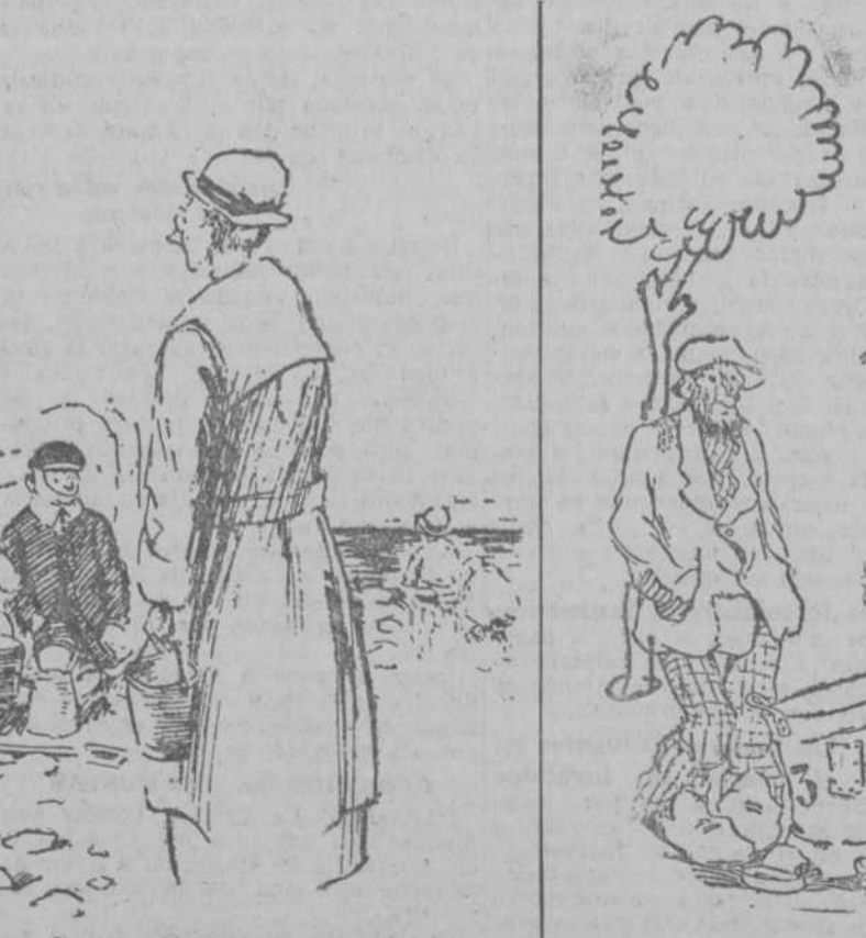
—A mí me tuvieron que operar en el Delta.