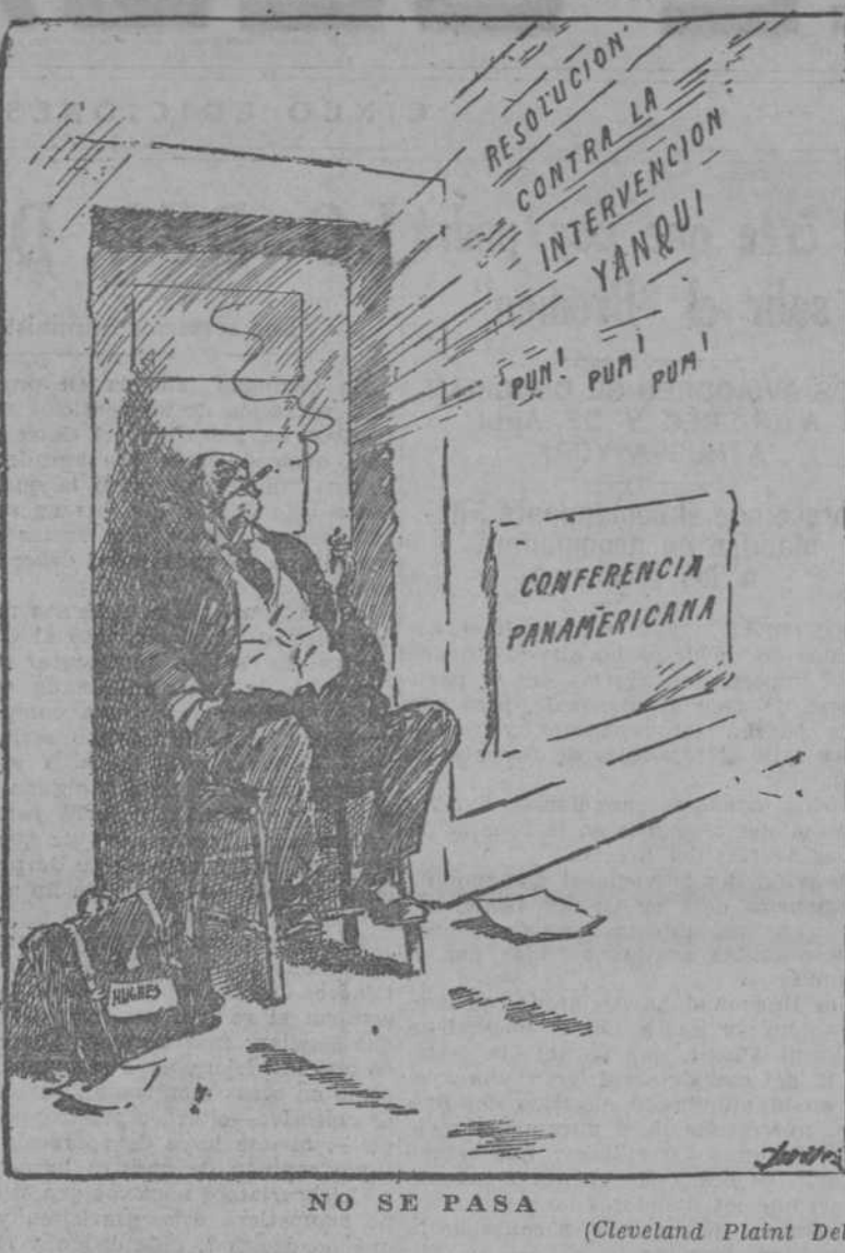
(Cleveland Plain Dealer)