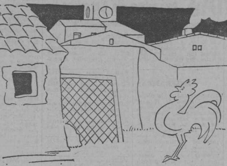
EL GALLO.—Las cinco y yo sin cantar. ¿A que me he quedado afónico?