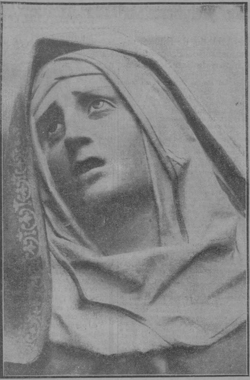
La Dolorosa de la Piedad, de Gregorio Hernández, que se conserva en el Museo Provincial de Valladolid

ZAMORA, 4.—A última hora de la noche salió la procesión del Silencio, formada por centenares de cofrades. Abrieron marcha tres hermanos a caballo ataviados con vistosas túnicas.