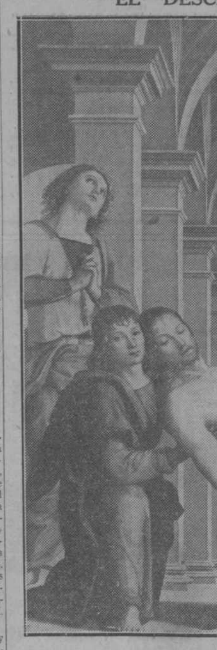
Este lienzo se conserva en la Academia de Bellas Artes de Florencia, y es una de las obras maestras de Pedro Vannucci, «el Peruginino», célebre pintor italiano, nacido en la ciudad del Piave, cerca de Perugia, en 1446, y muerto en 1524. El cuadro lo comenzó Filippo Lippi. De las primeras obras del «Peruginino» acaso la única que se conserva es «La Piedad», que se hallaba en el Palacio Pitti, de Florencia. En 1480 fué llamado a Roma para trabajar en la Capilla Sixtina, donde pintó tres frescos, per-