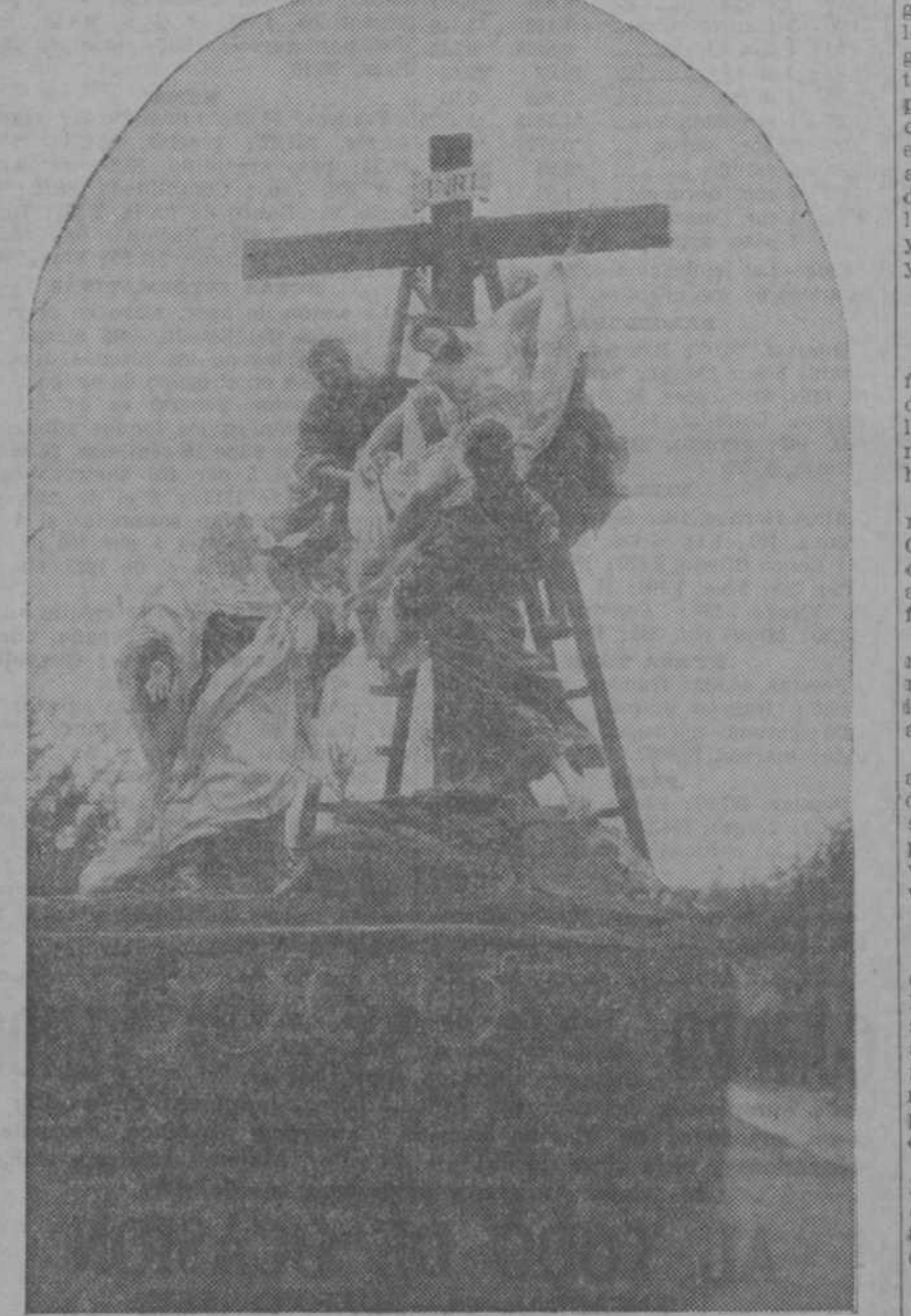
Paso del Descendimiento, propiedad de la Congregación de Nuestra Señora de los Siete Dolores, que estará hoy y mañana expuesto en la parroquia de Santa Cruz, de Madrid. No figura en la procesión del Santo Entierro.

Hoy nos place compararnos nuevamente de la importante Casa de ornamentos para Iglesia de los señores Javier Alcaide y Cia. Es tal la aglomeración de todo clase de objetos para el sagrado culto, así como para la ornamentación de templos y oratorios particulares, que el amplio local—situado en la calle de Alcaide y Cia, sito en la concurrida calle de Peligros, 11 y 13, resulta demasiado pequeño. Recomendamos a nuestros lectores no dejen de visitar este establecimiento donde tienen expuesto un magnífico Tabernáculo de madera tallada. Felicitemos por tan prodigioso desarrollo de su negocio a los señores Javier Alcaide y Cia, deseándoles aún mayores éxitos. Comidas de vigilia. Una taza de Manzana aromática «Espigadora», asegura una agradable digestión. Curra herpes, eczema, quemaduras, grietas, granullaciones. POMADA CEREAL Sabaliones ulcerados.