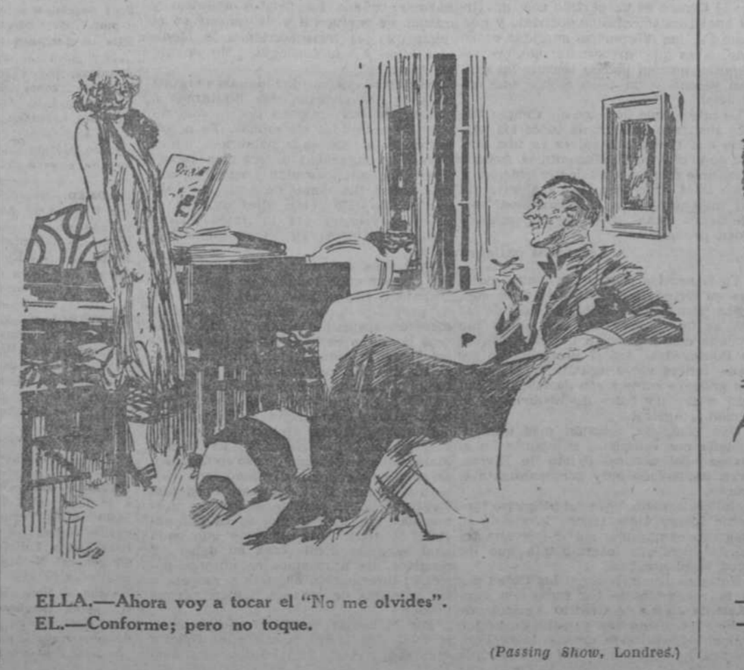
ELLA.—Ahora voy a tocar el «No me olvides». EL.—Conforme; pero no toque. (Passing Show, Londres.)