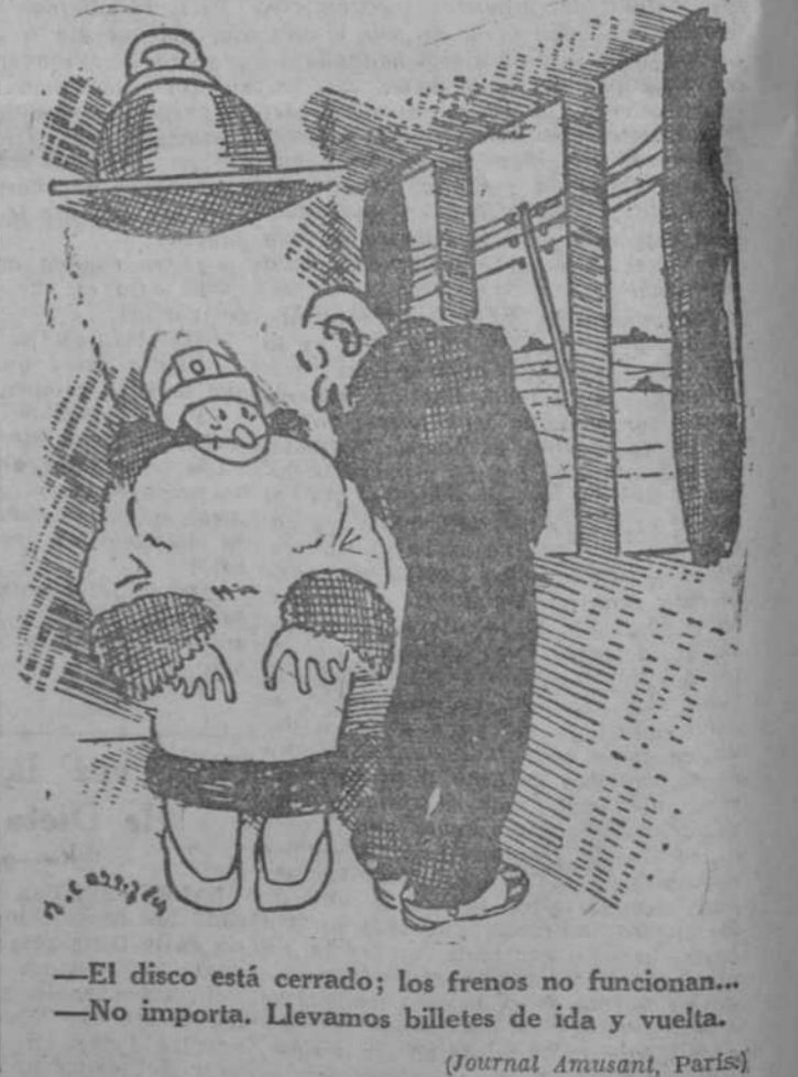
—El disco está cerrado; los frenos no funcionan... —No importa. Llevamos billetes de ida y vuelta. (Journal Amusant, París.)