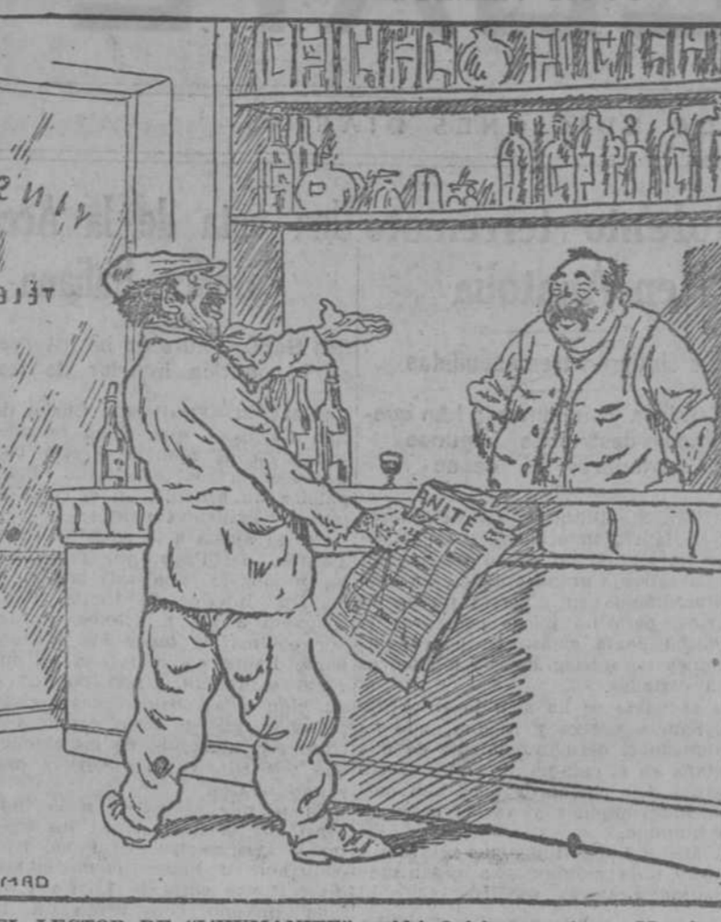
EL LECTOR DE «L'HUMANITE».—¡Ah! Quisiera morir en Moscú... y vivir en París.