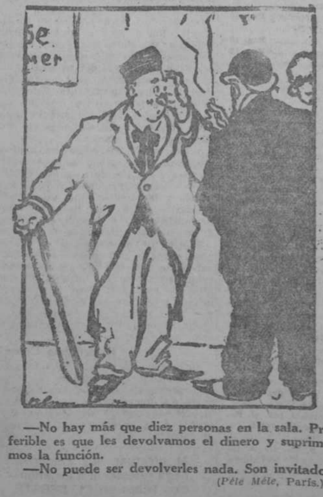
—No hay más que diez personas en la sala. Preferible es que les devolvamos el dinero y suprimamos la función. —No puede ser devolverles nada. Son invitados. (Pete Mété, París.)