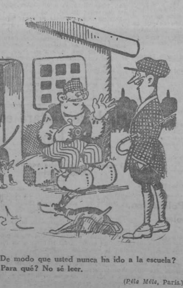
—¿De modo que usted nunca ha ido a la escuela? —¿Para qué? No sé leer. (Pete Mété, París.)