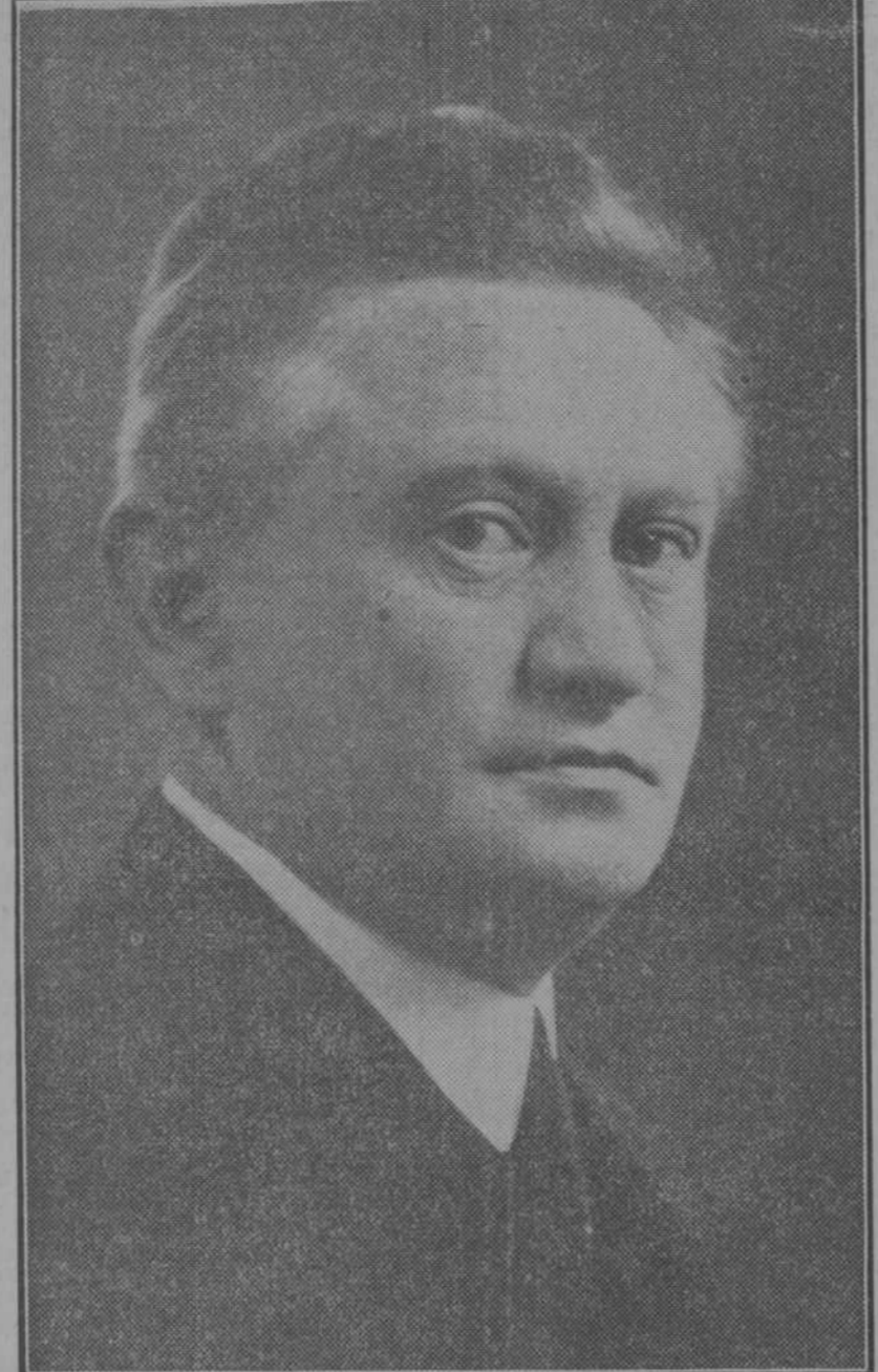
El doctor Hugo Obermaier, catedrático de la Universidad Central, a quien la Academia Prusiana de Ciencias ha nombrado miembro corresponsal de su sección histórico-filosófica