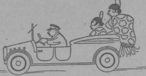
Un caballo Cuarenta caballos