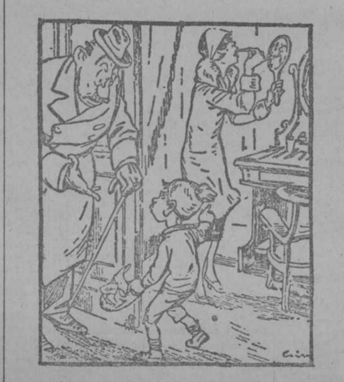
—Hijo, no estamos en Carnaval, y se prohíbe salir a la calle con careta. —Entonces, ¿a mamá por qué la dejan? (Nangel's Lustige Welt, Berlin.)