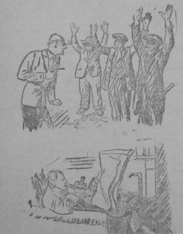
El detective distraído, que usa la pipa en la calle... y el revolver en casa. (New Yorker, Nueva York)

Lunes próximo estreno CINE DE SAN MIGUEL