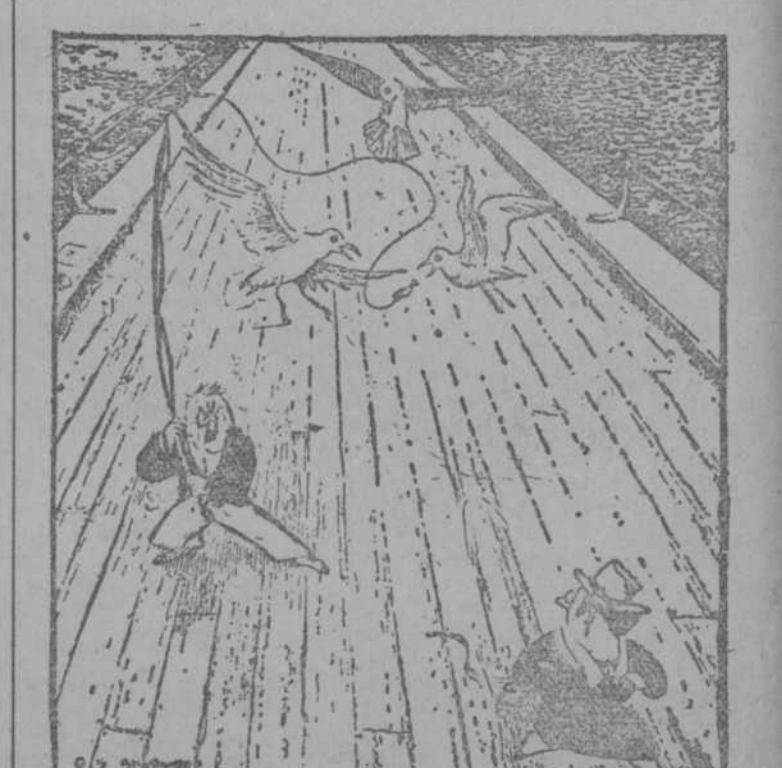
—¡Maldita sea! ¡Para eso estoy toda la mañana pescando! (Passing Show, Londres.)