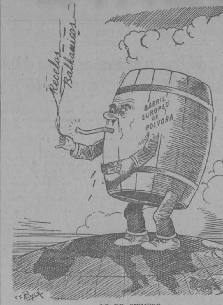
LO DE SIEMPRE (Brooklyn Times.)