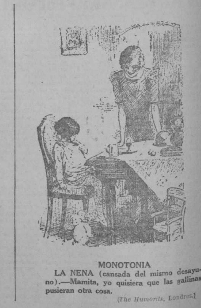
MONOTONIA (cansada del mismo desayuno).—Mamita, yo quisiera que las gallinas pusieran otra cosa. (The Humorists, Londres.)