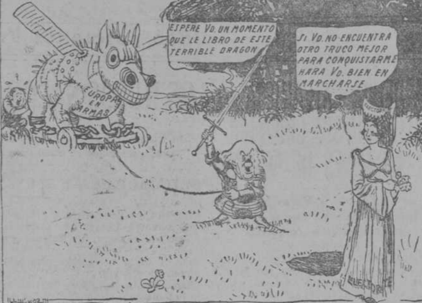
UN DRAGON PARA ANDAR POR CASA (Western Mail, Cardiff.)

Dos millones para la Casa de Francia en Madrid PARIS, 2.—El Senado ha votado un proyecto de ley, autorizando un crédito de dos millones de francos para los gastos de la construcción de la Casa de Francia en Madrid.