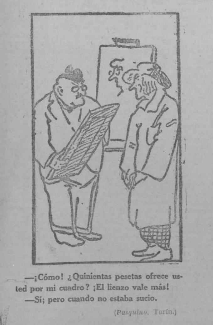
—¡Cómo! ¿Quinientas pesetas ofrece usted por mi cuadro? ¡El lienzo vale más! —Sí; pero cuando no estaba sucio. (Pasquino, Turín.)