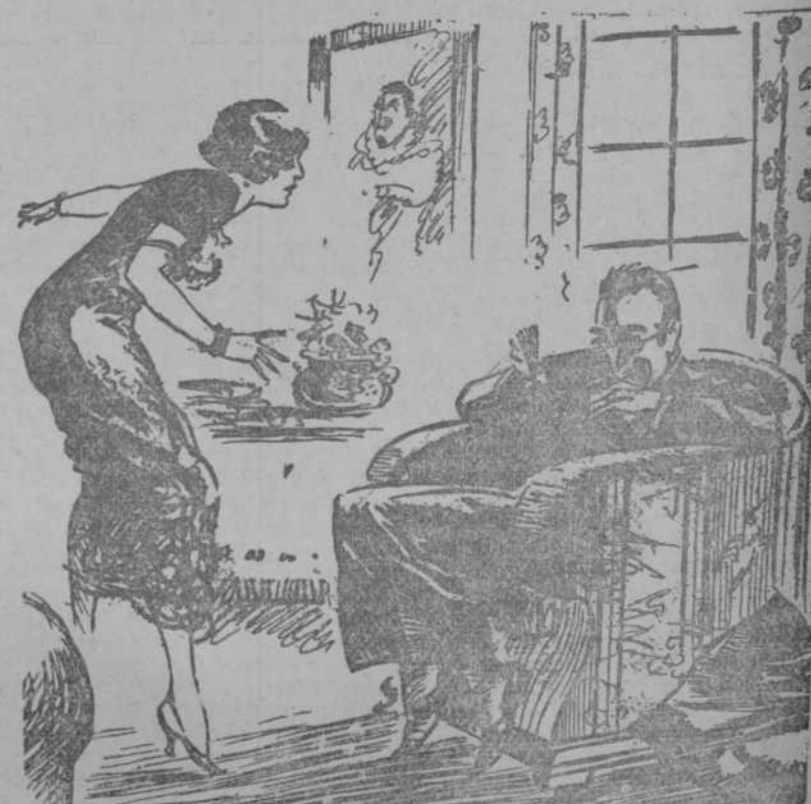
(The Passing Show, Londres.)

ELLA (alarmada).—¡Jack!... El niño se ha bebido la tinta. EL (distruido).—¿Y qué quieres?... ¿Que te preste mi estilográfica?