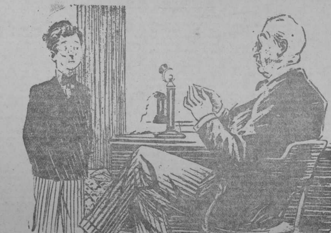
(London Opinion, Londres.)

EL JEFE (al chico de la oficina, que pide permiso para asistir al funeral de su abuela).—Mira, hijo mío, sé más económico...; no empieces a malgastar abuelas tan a principio de la temporada. Ahórralas para cuando lleguen los partidos finalistas.