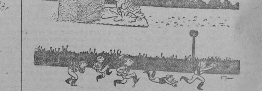
(Historieta de Passing Show, Londres.)

—¡Eh! ¿Con qué permiso se mete usted en mi propiedad a darse un banquete? —No, señor, no. Es sencillamente un «lunch». (Life, Nueva York.)