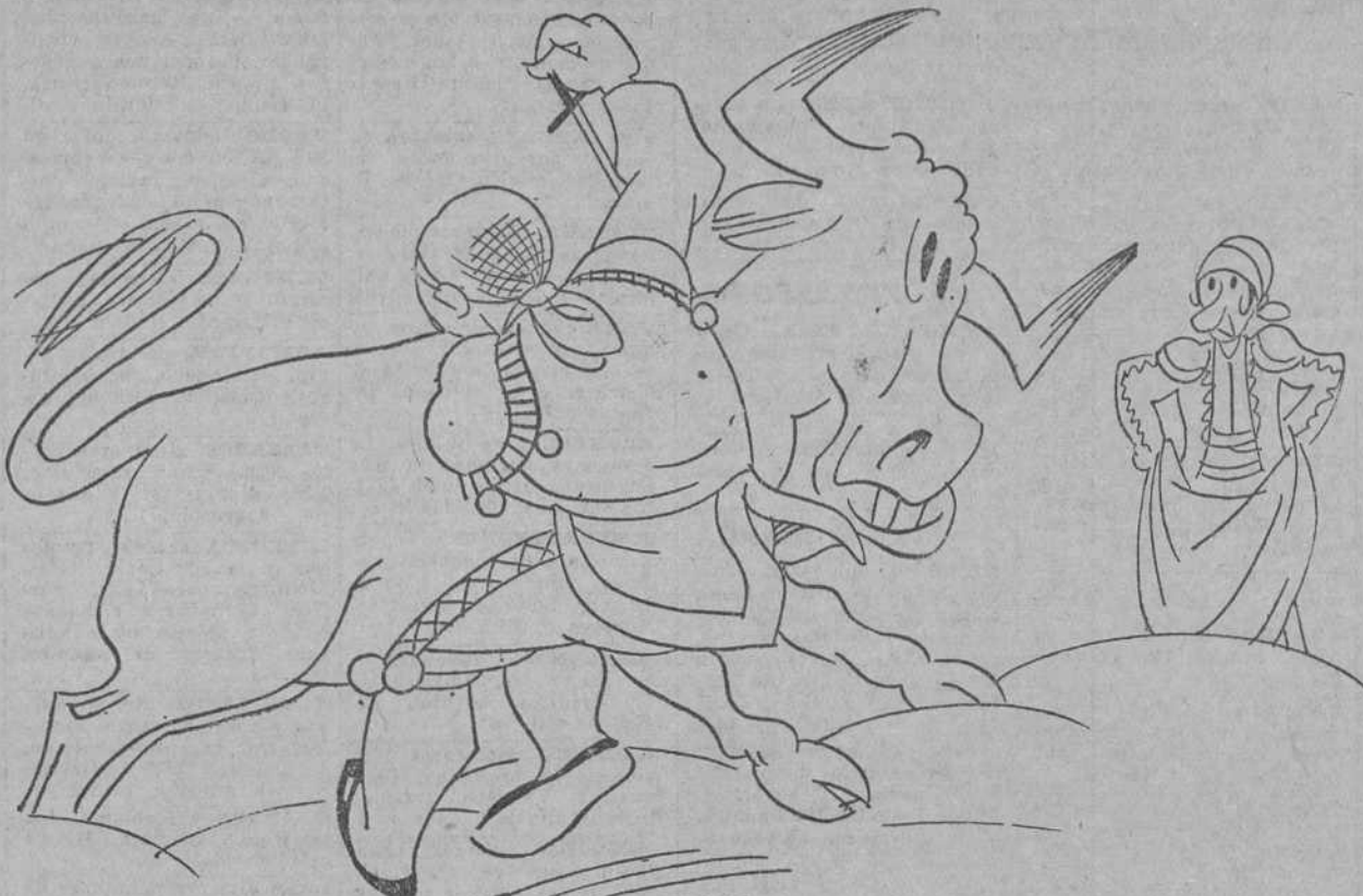
EL TORO.—Claro, y ahora el "golletazo".