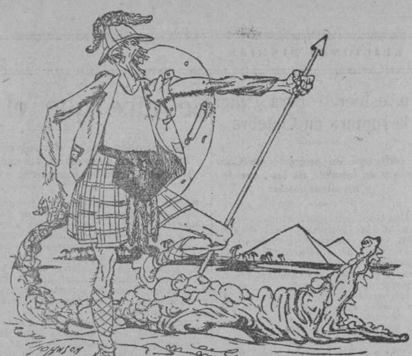
EL LOHENGRIN INGLÉS.—Y ahora gracias, cocodrilo mío; como tú, yo también soy del Nilo.

Van a comenzar de nuevo negociaciones entre Inglaterra y Egipto para resolver asuntos pendientes. A un periódico alemán el hecho le inspira una punzante parodia de «Lohengrin» .