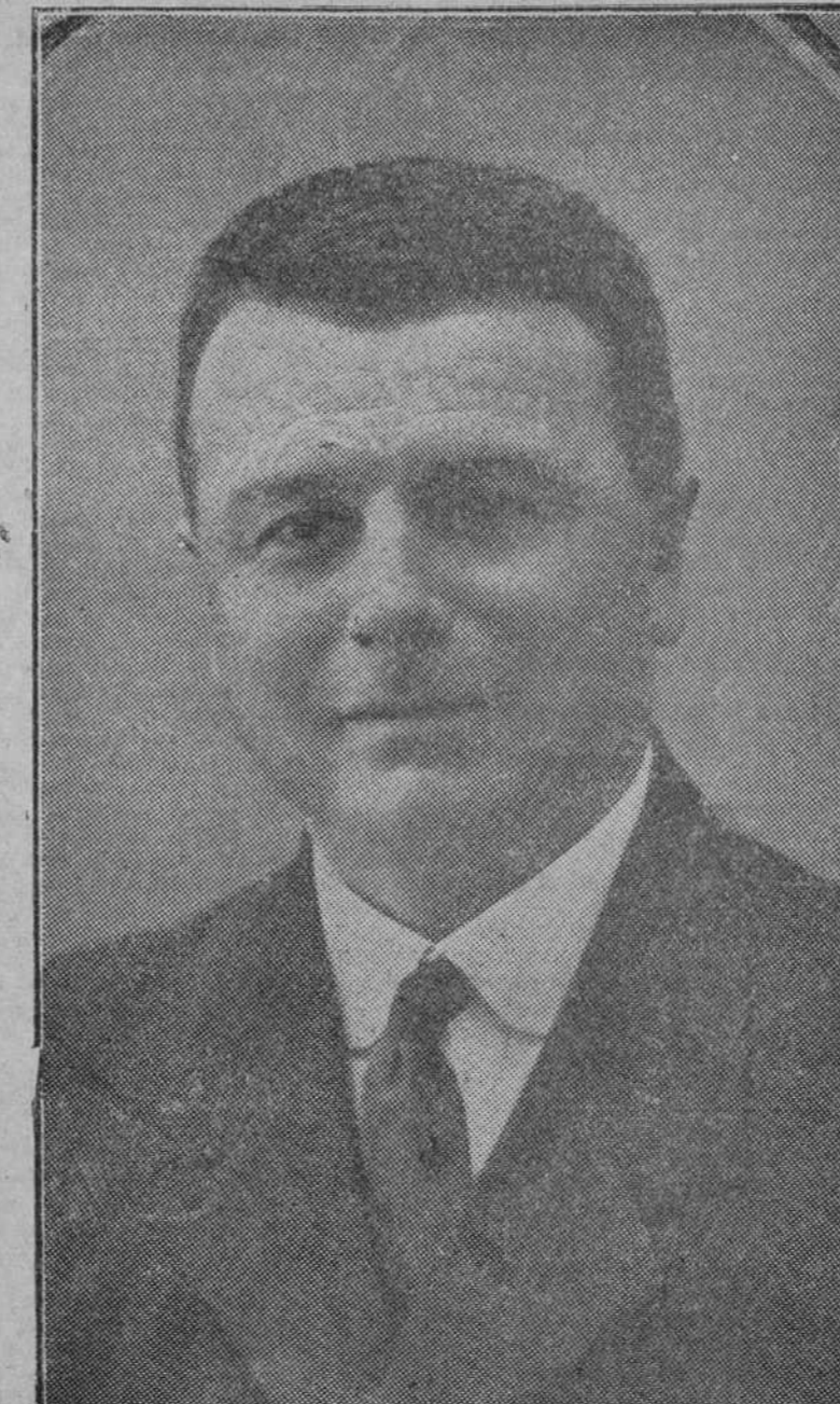
El ilustre pedagogo y literato don Manuel Siurot, que ha obtenido el premio «Mariano de Cavia», instituido por «A B C»

No es la de Siurot una figura a la que pueda mirarse sin sentir el contagio del calor, del dinamismo, de la fuerza ideológica que posee. Pedagogo —meistro más bien, título menos frívolo y más preciado—, escritor de altura, dueño de un lenguaje flexible, ágil, lleno de propiedad y de destreza; narrador ameno y de cuentos en los que se desliza la sal andaluza; orador florido, periodista, hombre bueno... Siurot es una cumbre moral, en la que brota espontáneamente una vegetación literaria, plena de sanos aromas y de robusta belleza. Entre sus obras son recordadas con gusto por los aficionados a la buena lectura «Cada maestrillo...», «La emoción de España», «Luz de las cumbres y resplandores de la Cruz», «Sal y Sol», «Mi relicario de Italia...». Reducir a cuento sus artículos es imposible. Durante mucho tiempo han visto la luz en la Prensa artículos de Siurot, vibrantes de entusiasmo patriótico, o llenos de noble amor a los niños, o simplemente aderezados con la gracia y el garbo de Andalucía. No viene, pues, el Premio Cavia a revelar un valor nuevo, sino a galardonar justamente un valor consagrado.