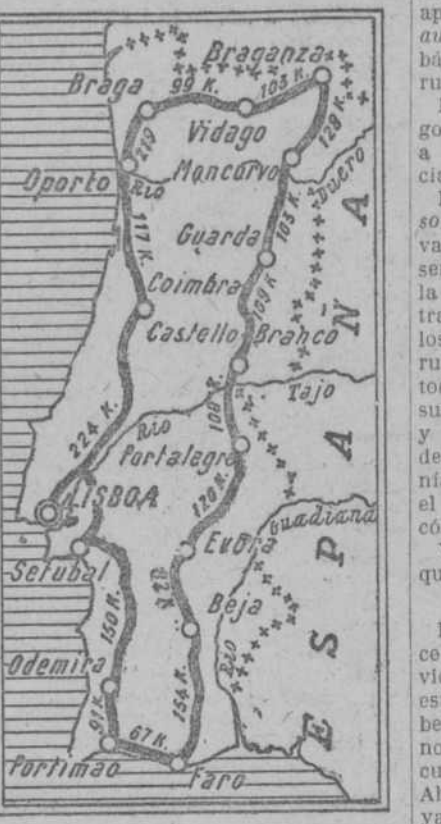
Recorrido de la Vuelta a Portugal

por su proximidad podrían participar corredores españoles. La Federación que rige los destinos ciclistas de Portugal proyecta para la primavera próxima, probablemente durante la segunda quincena de abril, la Vuelta a Portugal, una prueba que comprenderá un recorrido de más de 1.913 kilómetros, divididos en 16 etapas.