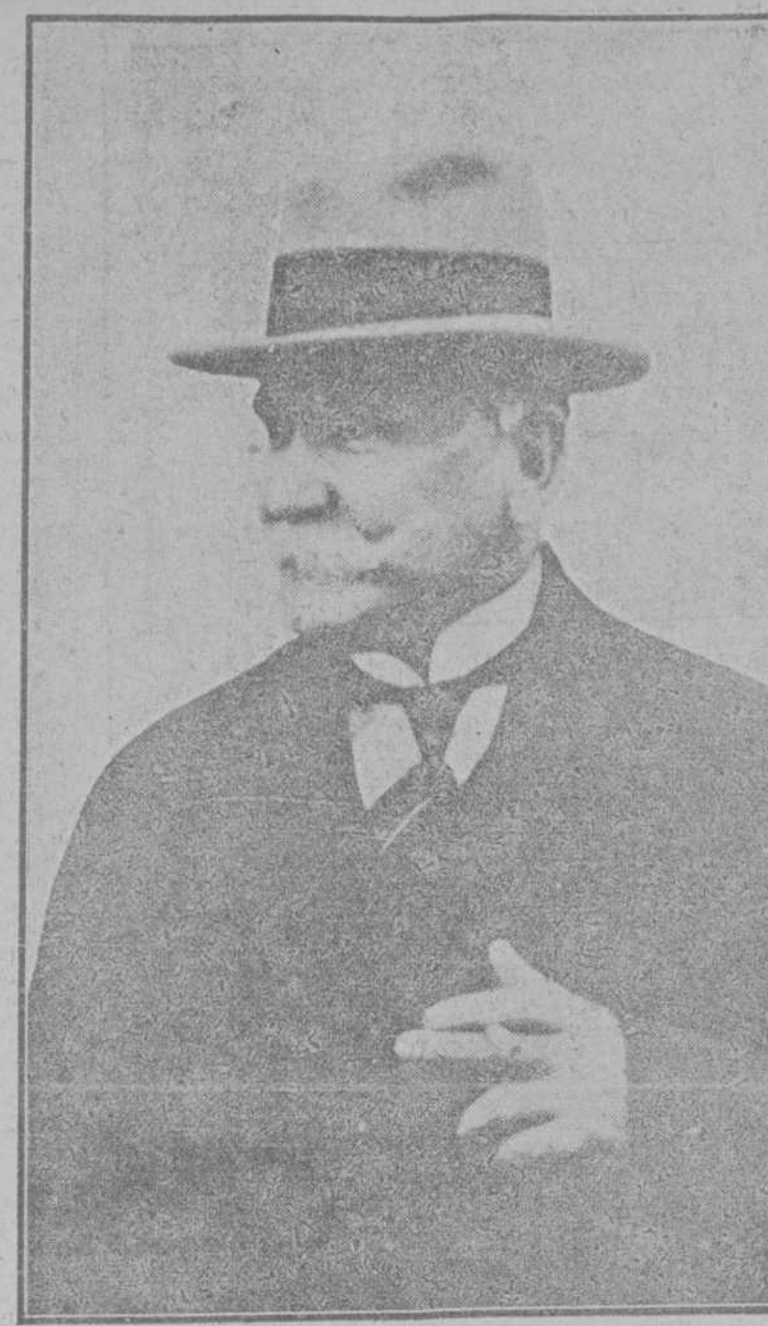
Uzunovich, presidente del Consejo yugoeslavo

Uzunovich fué nombrado presidente del Consejo de ministros en abril de 1926. Desde entonces ha tenido que constituir, por guardar las formas parlamentarias, según el mismo ha dicho, seis Ministerios. Se explica que haya tenido frases poco favorables para la Cámara. Hasta su nombramiento para la jefatura del Gobierno era un miembro distinguido del Club radical, y pocos hubieran visto en él al sucesor de Pachich, el gran político serbio.