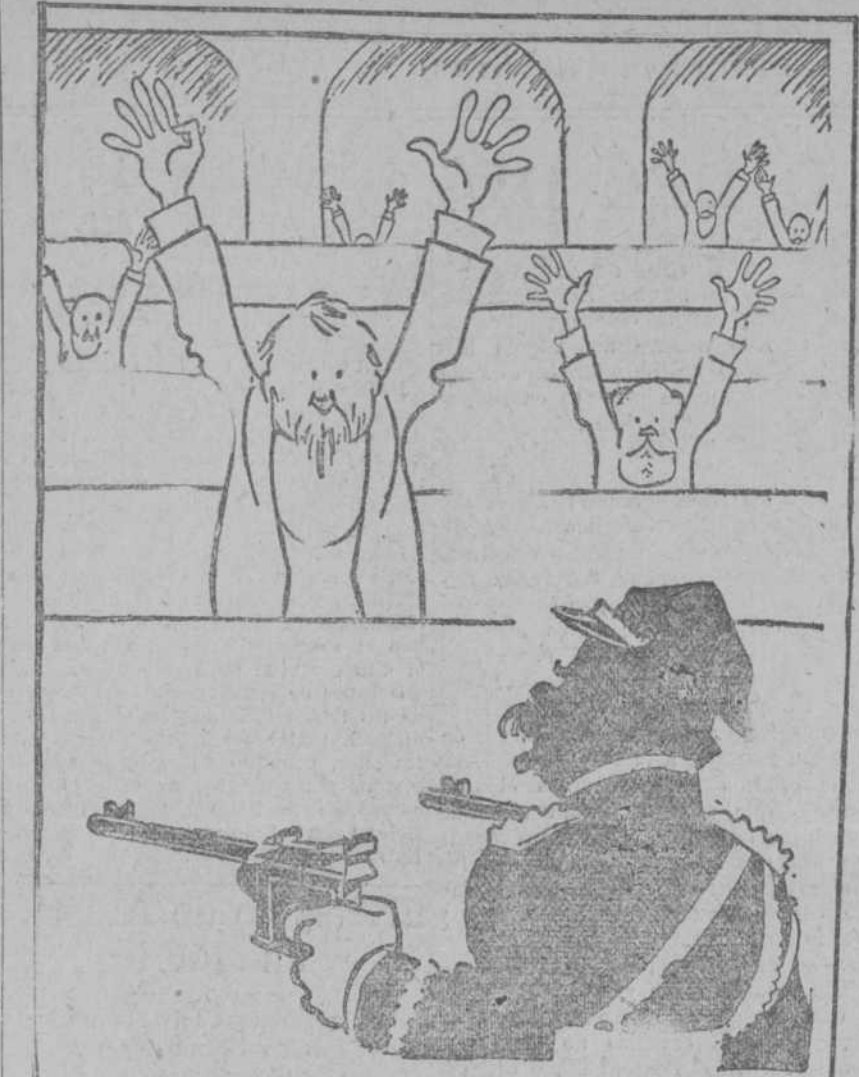
«Los suaves modales de la democracia, tal como se muestran en los Parlamentos de Lituania y Polonia»