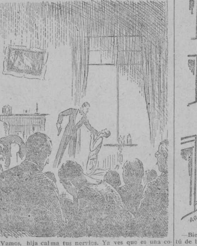
«Vamos, hija calma tus nervios. Ya ves que es una comedia. Si; pero lo que yo no puedo resistir ni un momento es aquel cuadro torcido.»