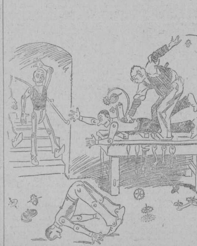
LA INDUSTRIA DE LA EPOCA. Taller de una Academia de bailes modernos.