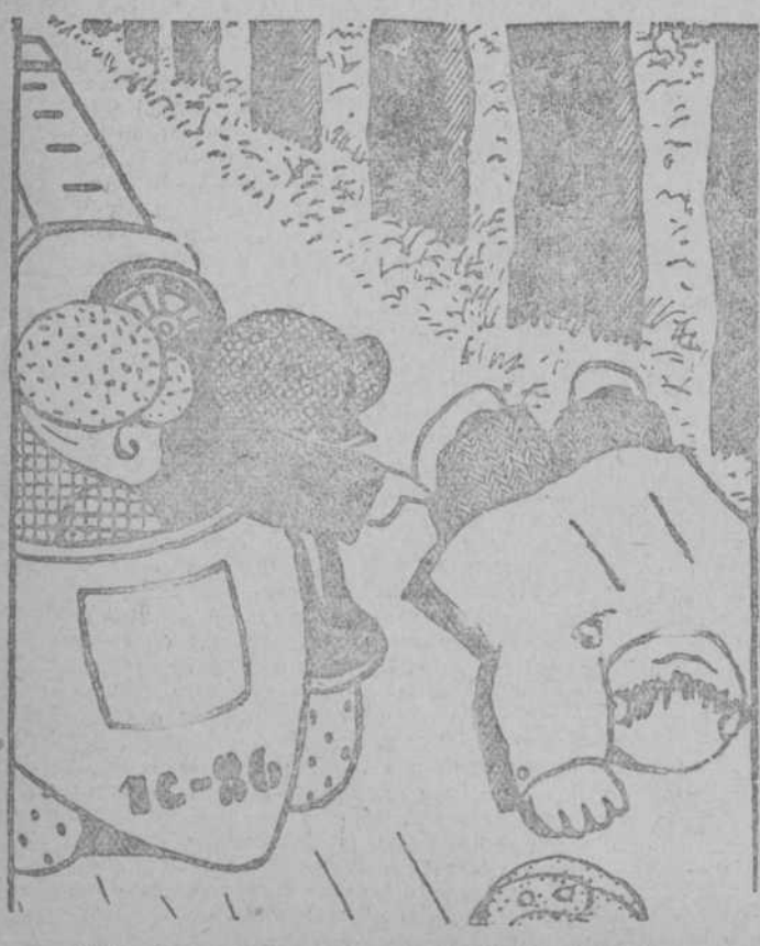
«¿Ves cómo no nos hemos perdido? Es el mismo camino. Ahí tienes el prójimo que atropellamos esta mañana.»