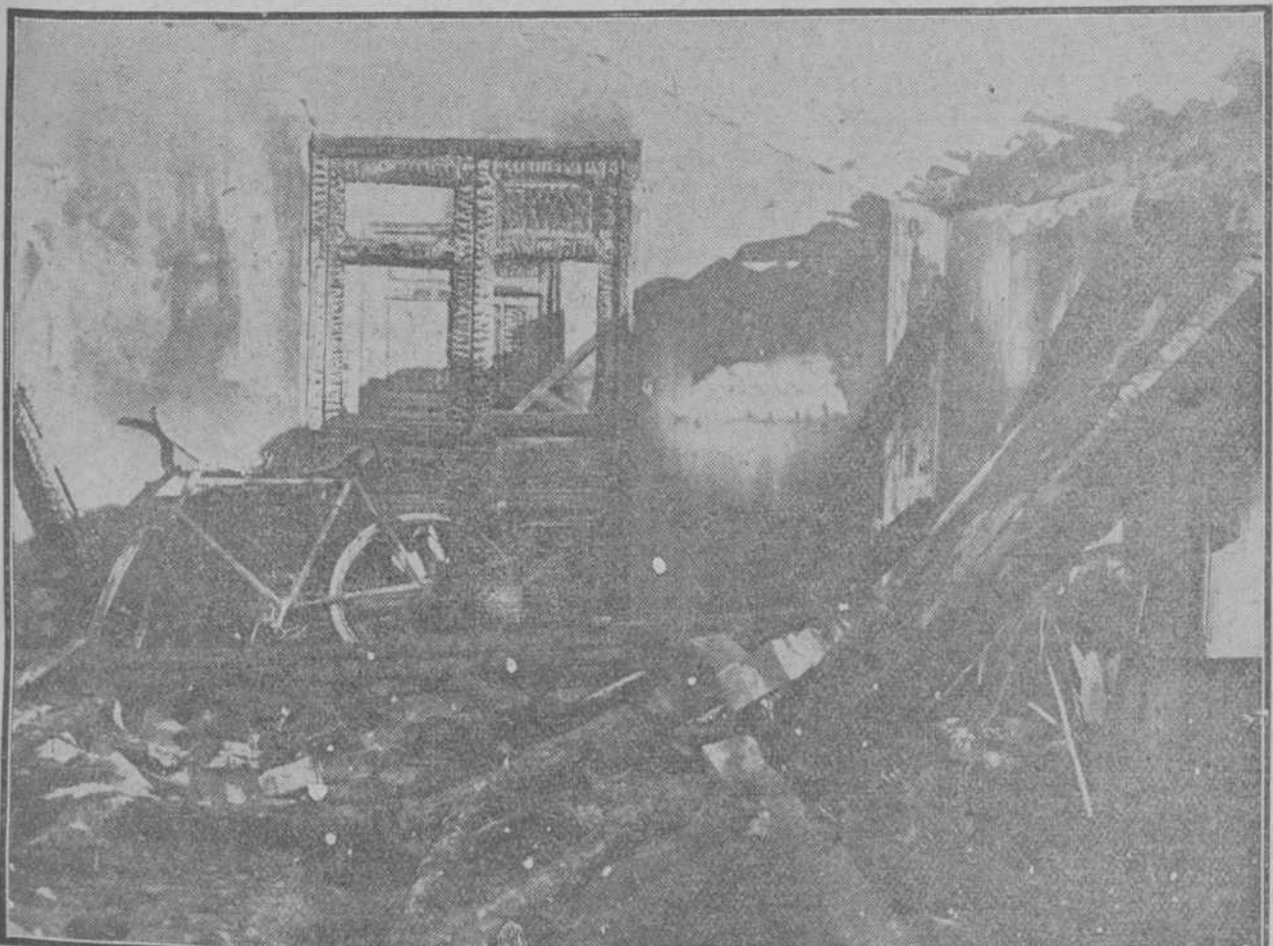
Estado en que quedó la Central después del horroroso incendio de ayer