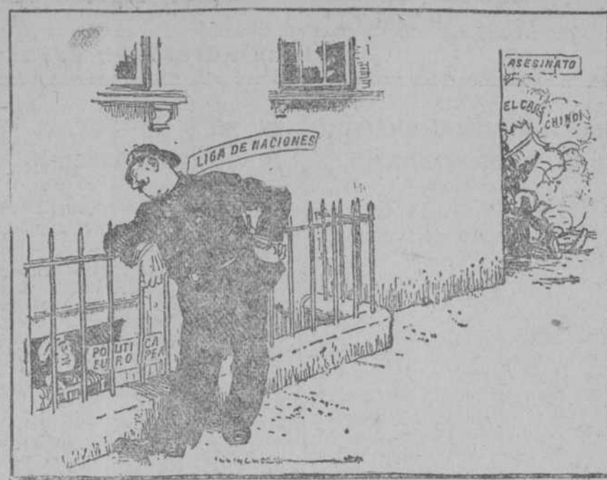
Está demasiado ocupada para meterse en los

Algunos políticos y periódicos ingleses han indicado que podía intervenir la Sociedad de Naciones en el conflicto chino. La mayor parte de la Prensa se ha burlado de los que hacían semejante proposición. «The Western Mail» de Cardiff, comenta ese proyecto con la caricatura que reproducimos, satirizando al mismo tiempo a los autores de él y al organismo de Ginebra.