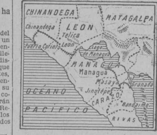
Mapa de la zona de disturbios en Méjico y Centroamérica.

BIRMINGHAM, 13.—Ayer se declaró un violento incendio en un inmueble del centro de la ciudad, pereciendo siete personas, entre ellas tres niños. El inmueble quedó destruido.