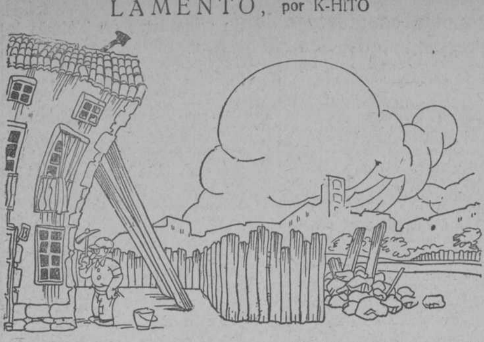
—Maldito trabajo que no deja un momento libre! Me voy a quedar sin saber qué es eso de la Exposición de Madrid Antiguo.

Es tan dura, tan pertinaz y tan perversa la campaña que se hace en todos los terrenos contra la familia... La familia barata... Maldito trabajo que no deja un momento libre! Me voy a quedar sin saber qué es eso de la Exposición de Madrid Antiguo.