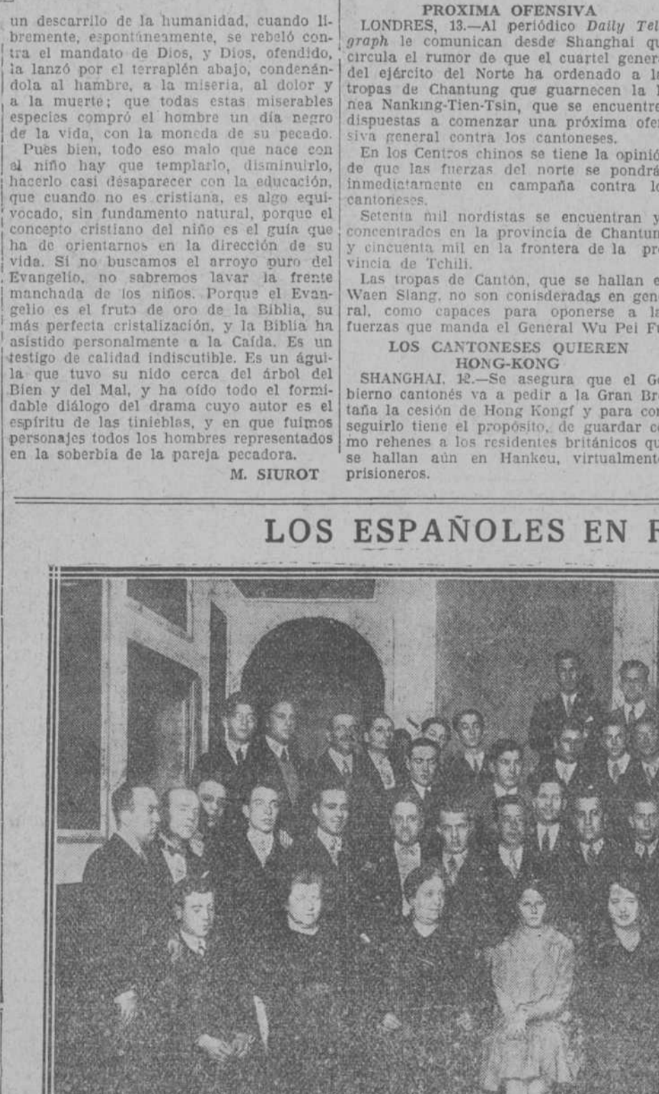
Un grupo de jóvenes de la peregrinación de los Luises, en la Casa de España, en Roma