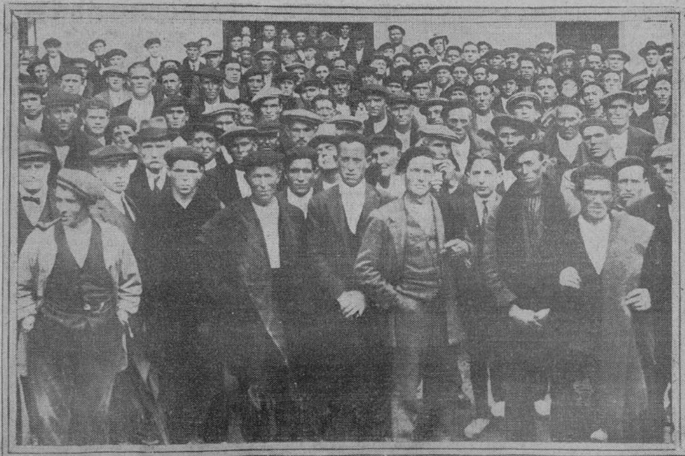
Representantes de los Sindicatos de Aragón, Navarra y Rioja, que han asistido a la Asamblea extraordinaria de Zaragoza, convocada para tratar de la defensa del cultivo amenazado.