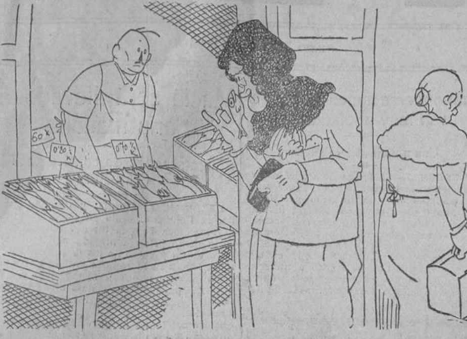
—De Alicante, señora. No lo huelo porque acaba de llegar. —Pero ¿ha venido andando, verdad usted?