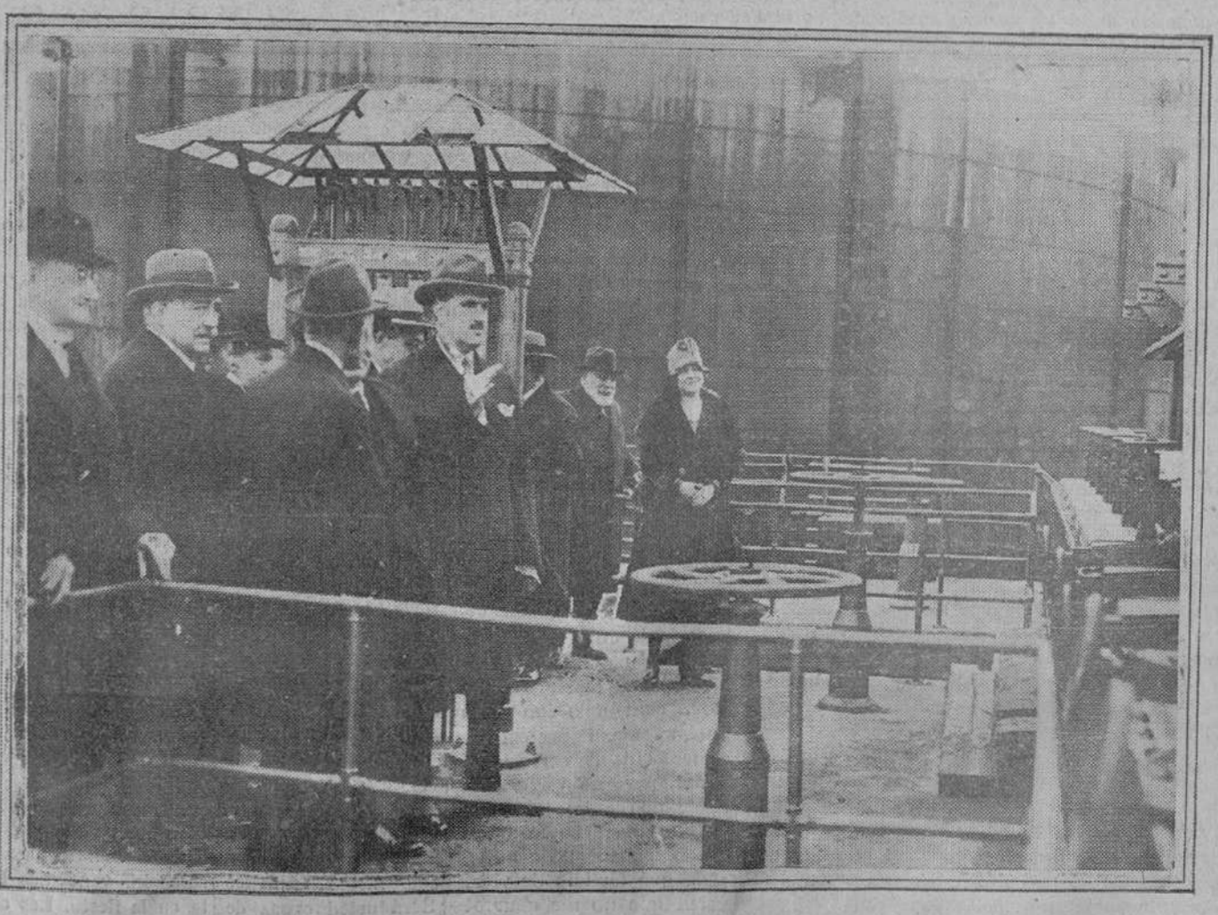
El alcalde, conde de Vallellano, con algunos concejales y los directores de la fábrica, visitando las nuevas instalaciones que mejorarán notablemente el alumbrado en Madrid