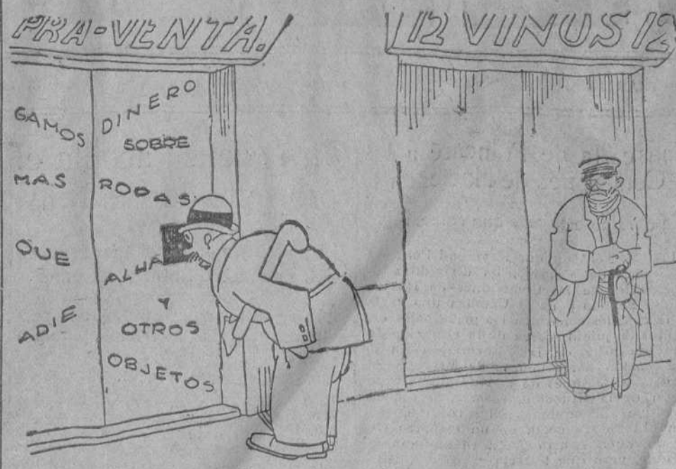
—¡Eh! ¡Manolo! ¡E! 3.347 haga el favor de retrasármelo una hora!