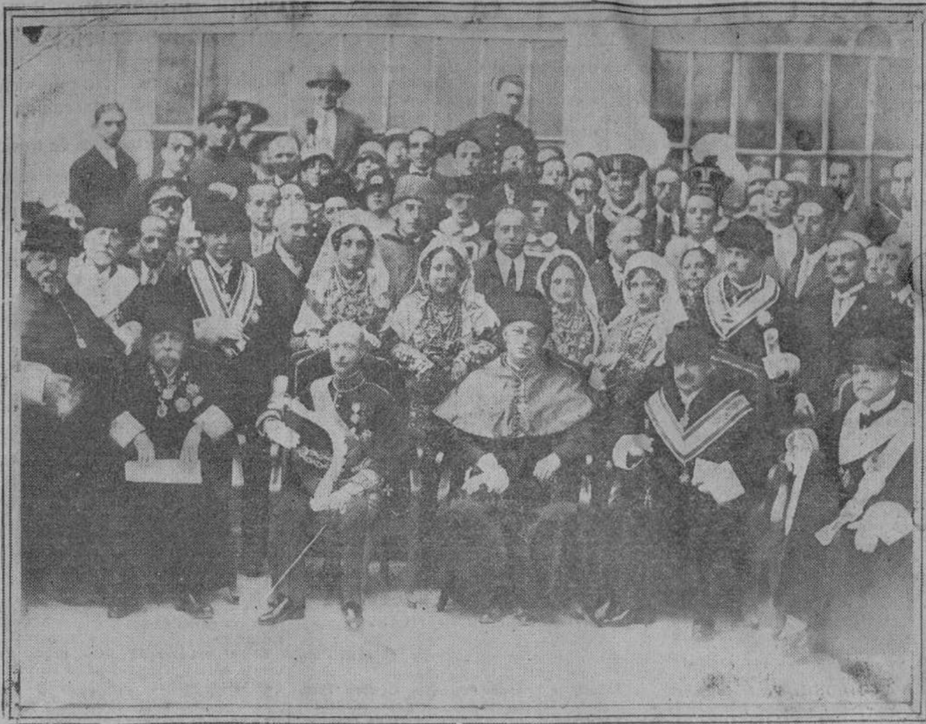
El general Primo de Rivera, el ministro de Instrucción pública, los rectores de las Universidades de Salamanca y Coimbra y las autoridades, después de serle impuestas al primero las insignias de doctor «honoris causa» de la Universidad de Salamanca.