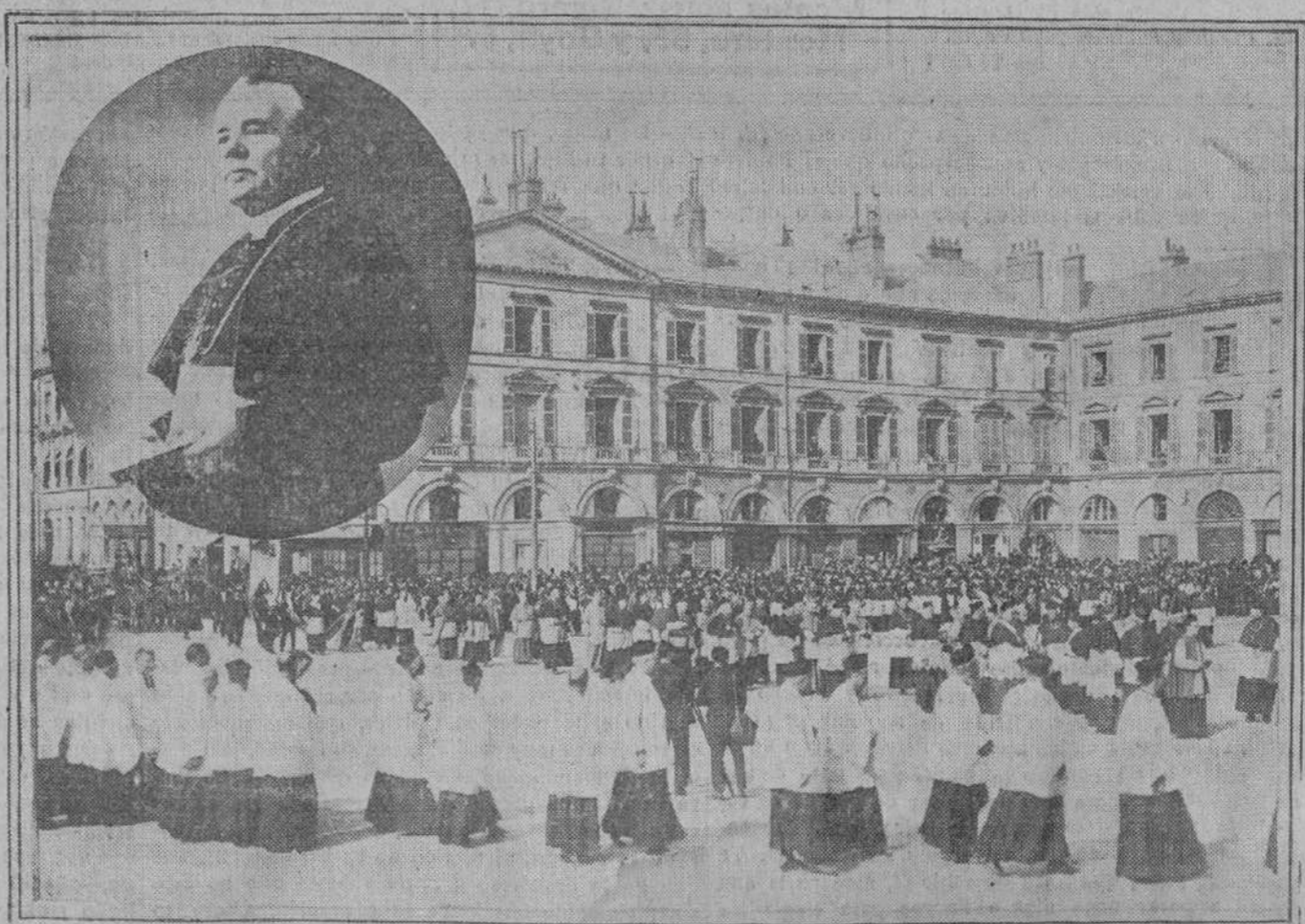
La comitiva fúnebre a su paso por la plaza de Santa Cruz de Orleans; la carroza va precedida de numerosos Cardenales y Obispos. Se calcula que asistieron al acto más de 50.000 personas. En el medallón, retrato del Cardenal Touchet.