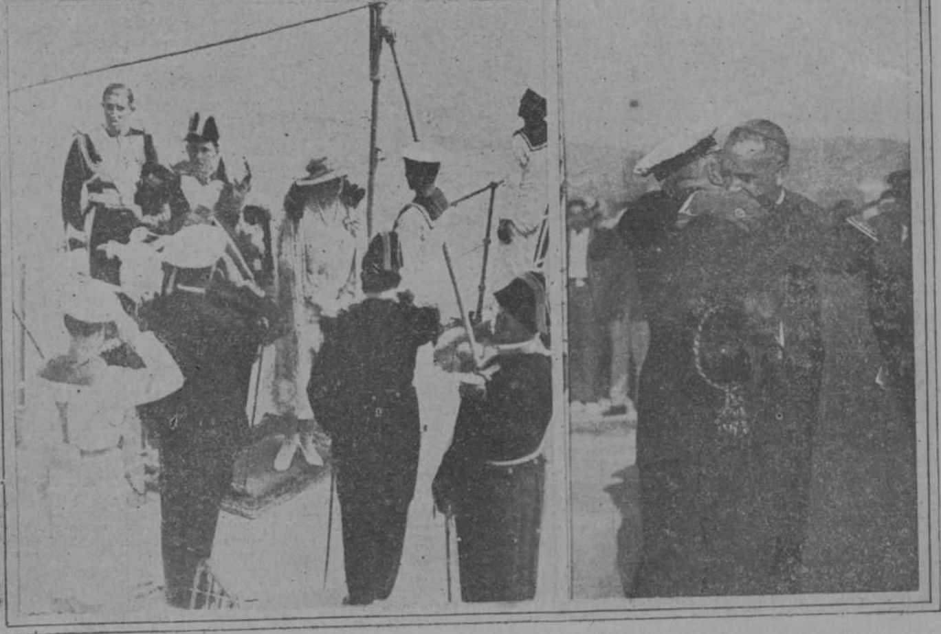
SANTANDER.—La Reina leyendo su discurso después de entregar la bandera de combate al «Reina Victoria Eugenia». La familia real al legar al crucero. VIGO.—El ministro de Marina abraza al Obispo de Madrid, que acudió a recibirle.