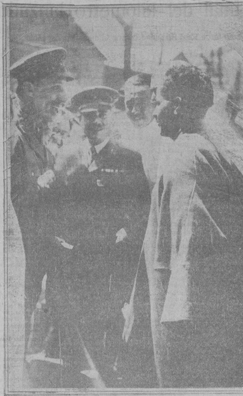
Su majestad el Rey conversando con un soldado convaleciente en el Hospital Militar de Carabanchel, durante su visita hecha ayer mañana