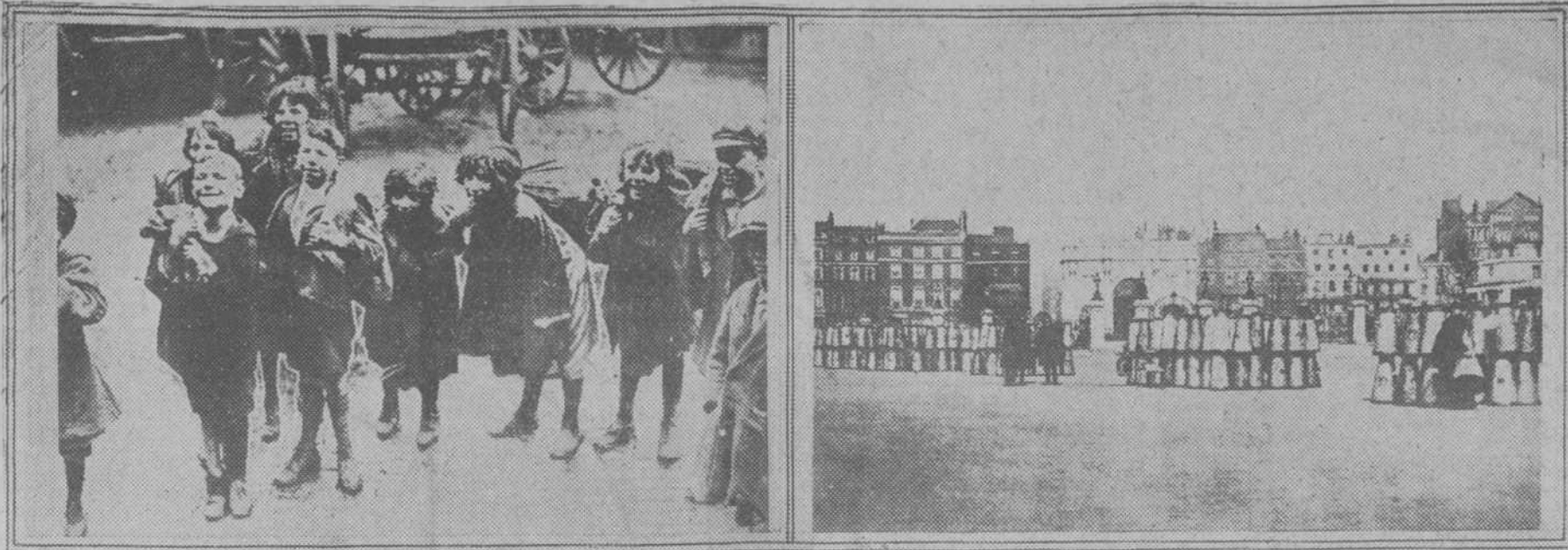
A la izquierda: Niños que han recogido restos de carbón y que alegres los transportan en los sacos a sus casas. A la derecha: Pirámides de cántaros de leche amontonados en el Hyde Park