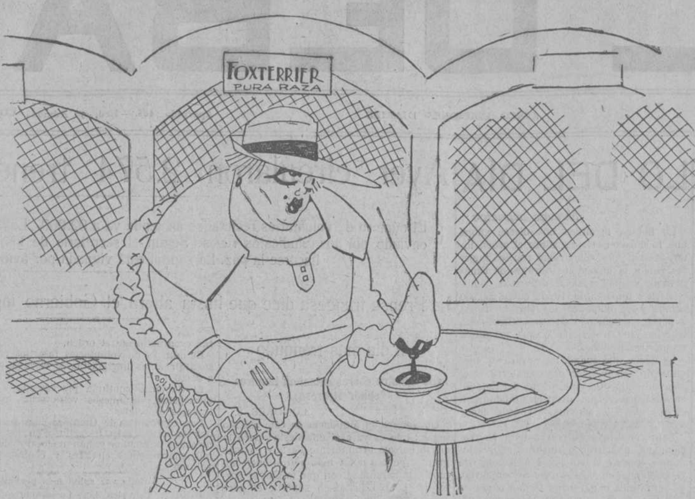
Apunte del natural

El secretario de los mineros Cook ha declarado hoy que no había ningún cambio en la situación. 'Nada indica—dijo—que vaya a haber paz.