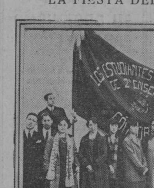
Alumnos del sexto año del Bachillerato, de Córdoba, que tomaron parte en la velada celebrada en el Gran Teatro, con motivo de la fiesta del Estudiante

CASA MELILLA BARQUILLO, 6 DUPLICADO Artículos para todos los deportes. Juguetes finos y baratos. Coches para niños con suspensión, desde 100 pesetas. Esta casa es la mejor surtida y que más barato vende, por ser la única que tiene fábrica propia.