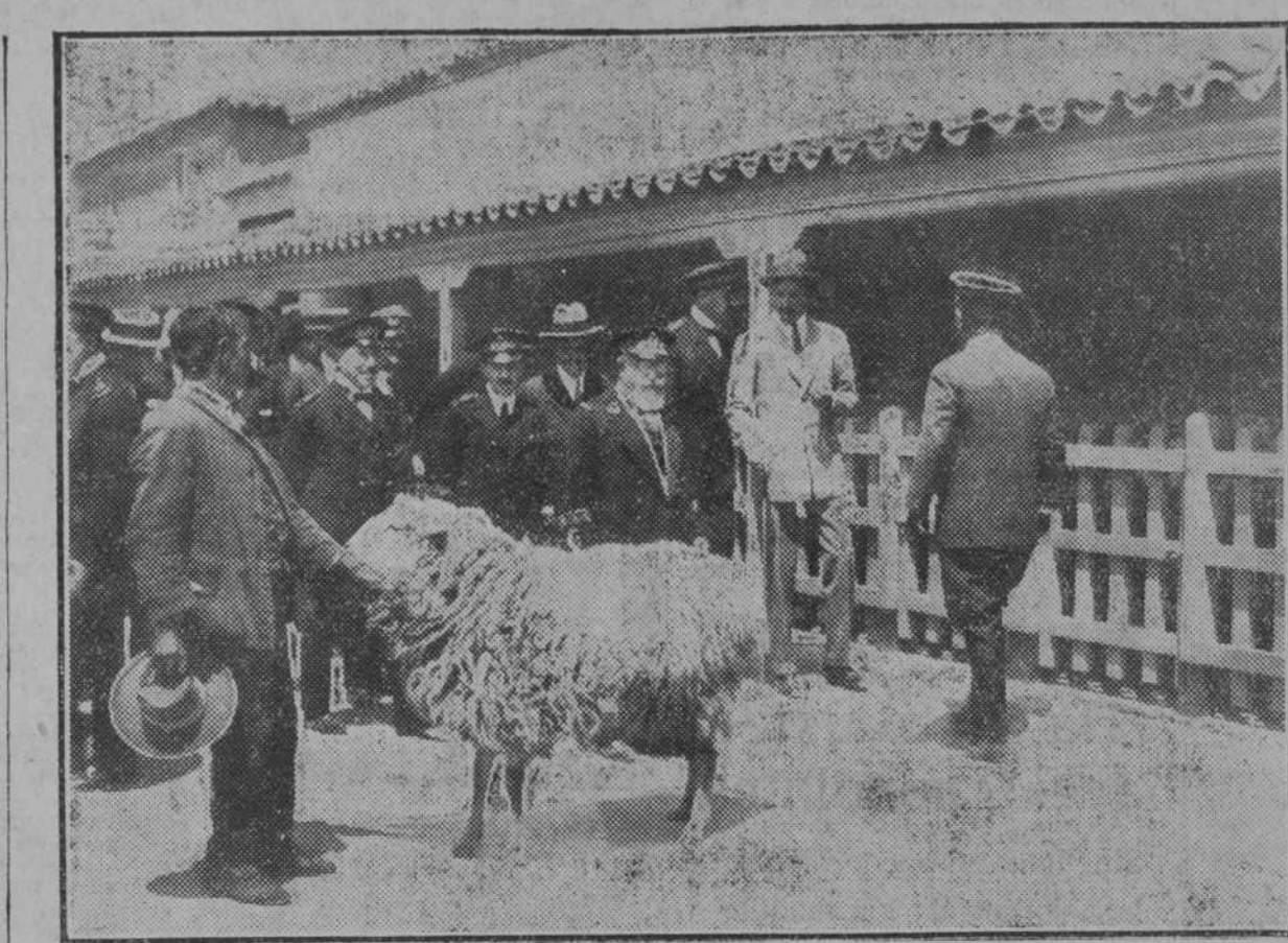
El Rey examinando un ejemplar de cordero Lincoln-Churro, en su visita a la Granja de la Moncloa.