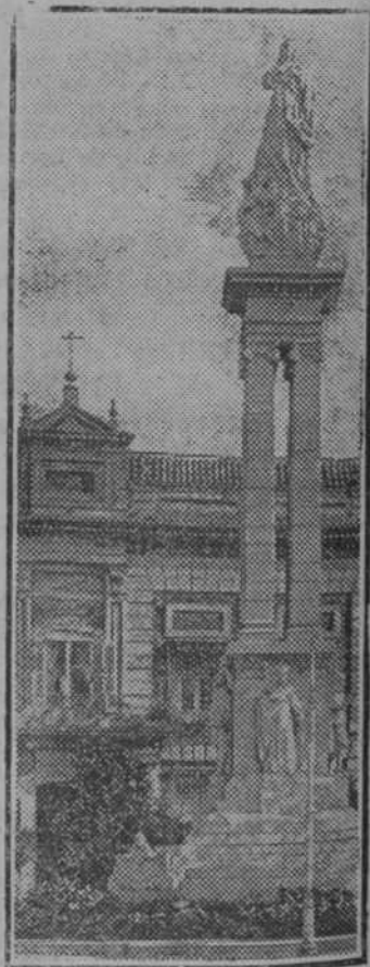
SEVILLA.—Monumento a la Purísima Concepción

La casa Sobrino de Izquierdo posee la exclusiva para editar las obras del malogrado e ilustre escritor Muñoz y Pavón, habiendo puesto a la venta recientemente una selección de los mejores escritos del gran novelista, titulada Vividos y contados al precio de cuatro pesetas ejemplar.