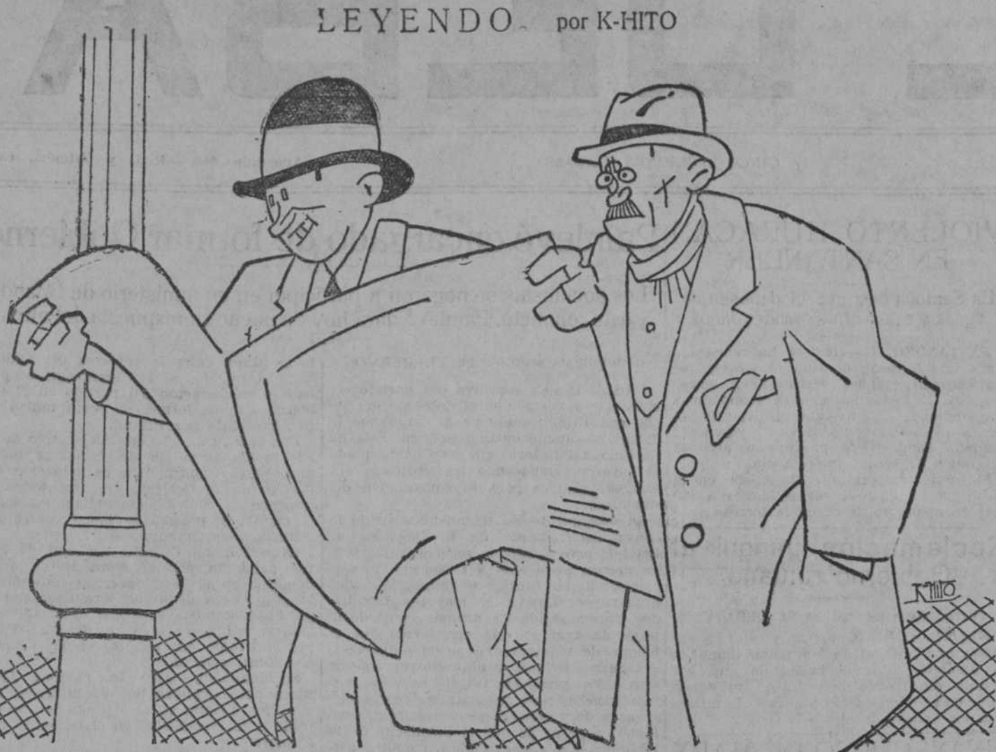
«Crisis teatral». —¿Aquí? —No; en Francia.

El agua ha caído copiosamente sobre la huerta, asegurando abundantes cosechas a los agricultores, que bendicen una vez más la celestial protección de la venerada Virgen.