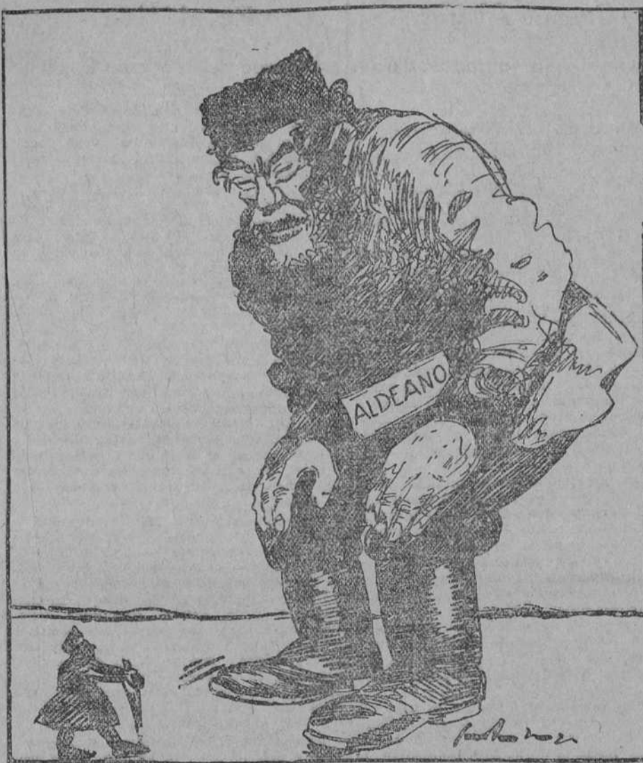
(El bolchevique encuentra imposible matarlo)