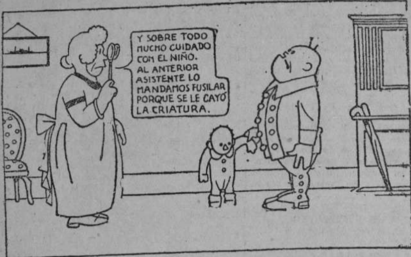
I —A la orden, mi coronela. Pierda usted cuidado.