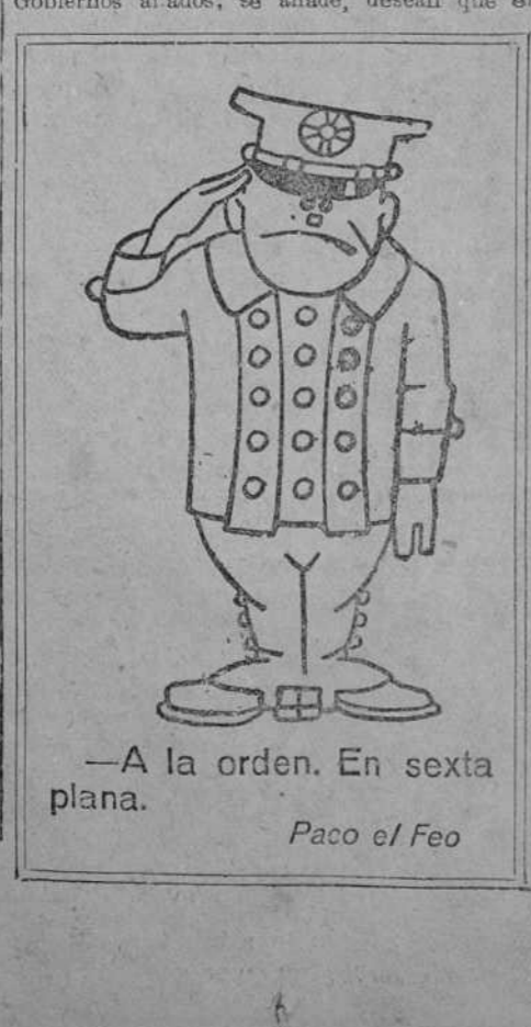
—A la orden. En sexta plana. Paco el Feo

Diez años de trafico en el canal de Panamá (RADIOGRAMA ESPECIAL DE EL DEBATE) NAUEN, 16.—Ayer cumplieron diez años desde que fué abierto a la navegación el Canal de Panamá. El total de barcos que lo han cruzado es el de 23.100.—T. O.