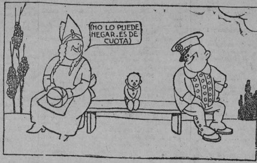
II (Estas en cuanto ven un «militar»...)