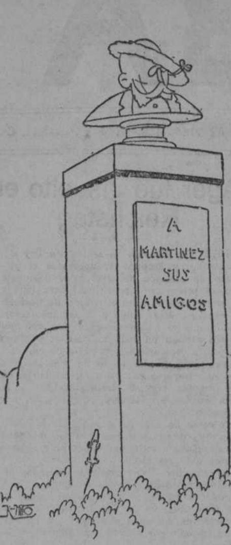
—Perdona, chico. Tú sabes que todos los años te traemos una corona de laurel, pero éste, al precio que te dan las verduras, te la hemos puesto de pesas por la sopa.