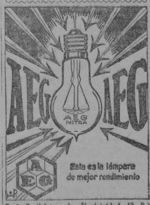
Esta es la lámpara de mejor rendimiento

El cura párroco de Solana del Pino (Ciudad Real) que haramos un llamamiento a las personas piadosas para que contribuyan, en la proporción que sus recursos lo permitan, a suministrar fondos con objeto de que puedan reanudarse las obras de reconstrucción de la iglesia de aquel pueblo, recientemente derruida.