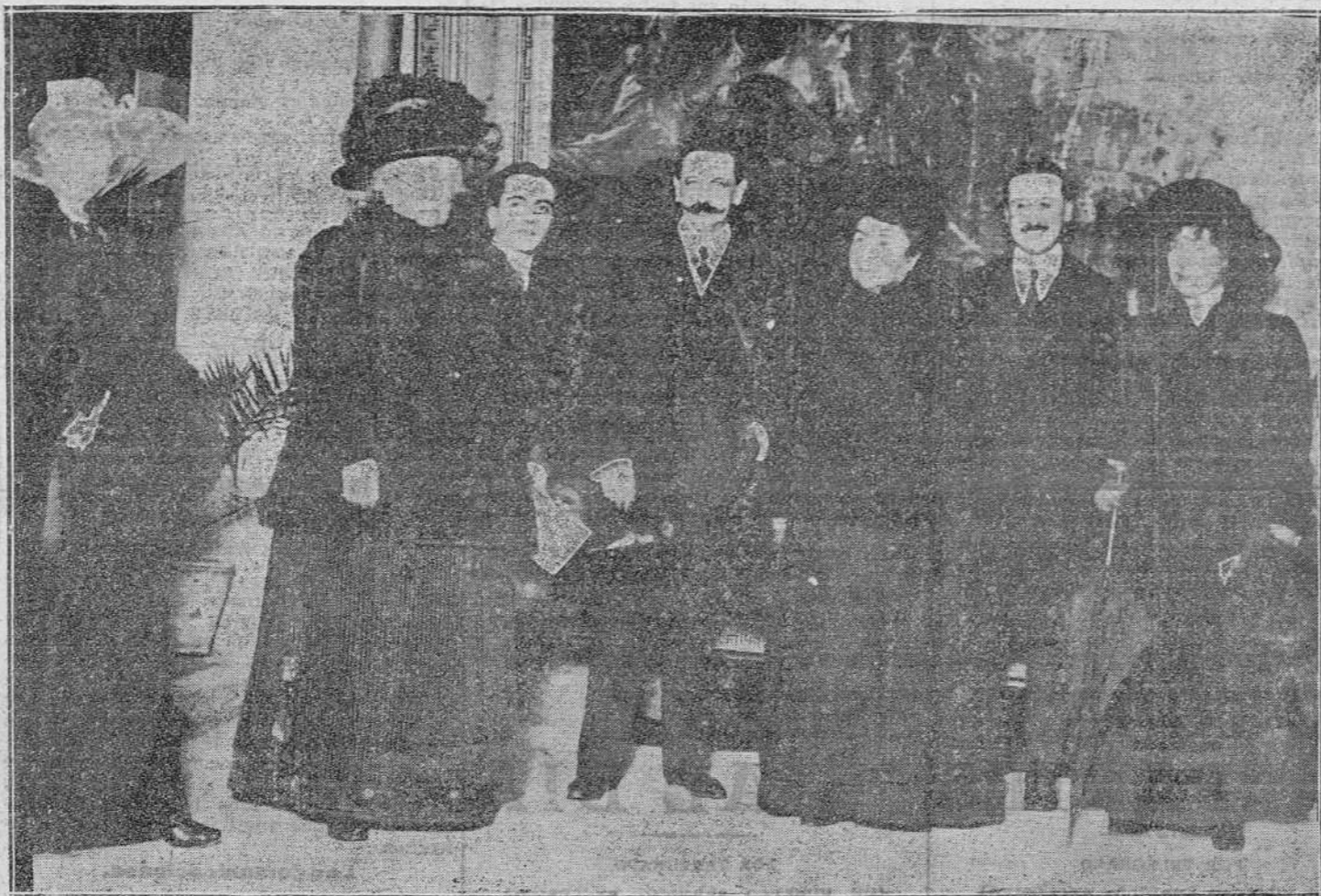
S. A. LA INFANTA ISABEL, VISITANDO LA EXPOSICIÓN VILLODAS

Publicados ó no, no se devuelven originales. Los que envíen original sin contratar antes con la Empresa del periódico, se entiende que suplican la inserción gratis.