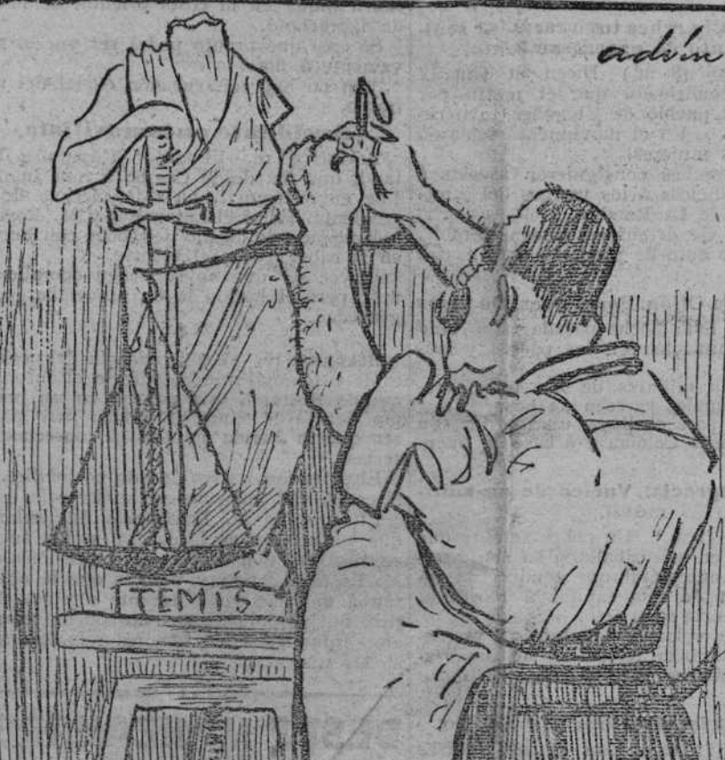
Pues señor, ya tiene flamante espada y magnífica balanza... pero le falta la cabeza.