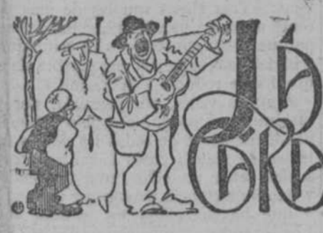
Ya era hora.