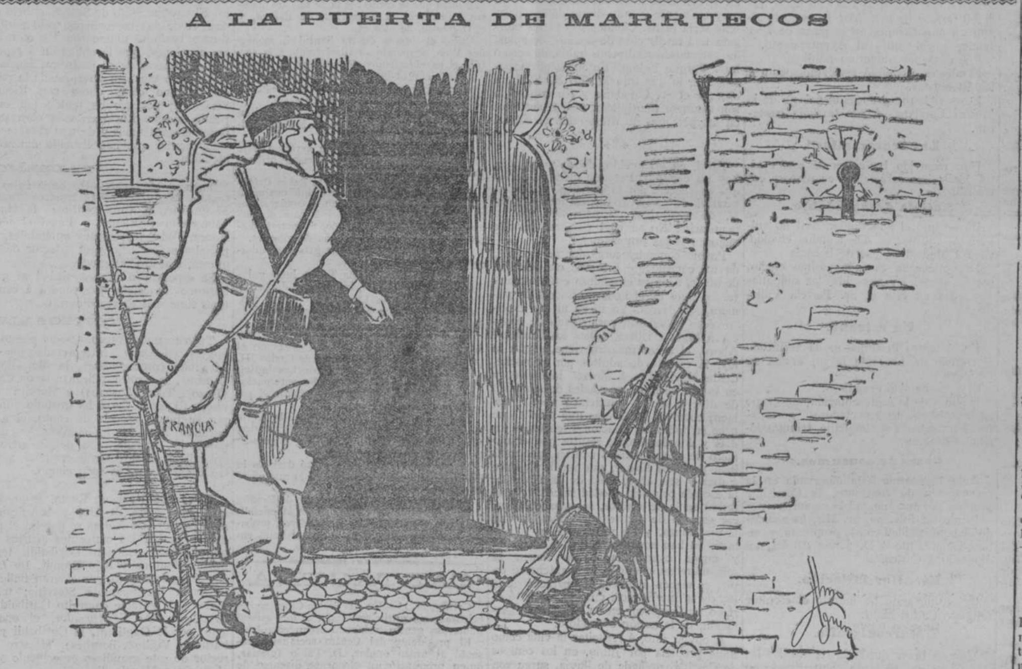
FRANCIA.—Lo que yo desearía es entrar antes que se desportara el centinela.