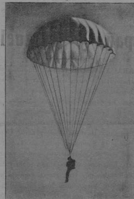
Momento tranquilo y sereno del descenso