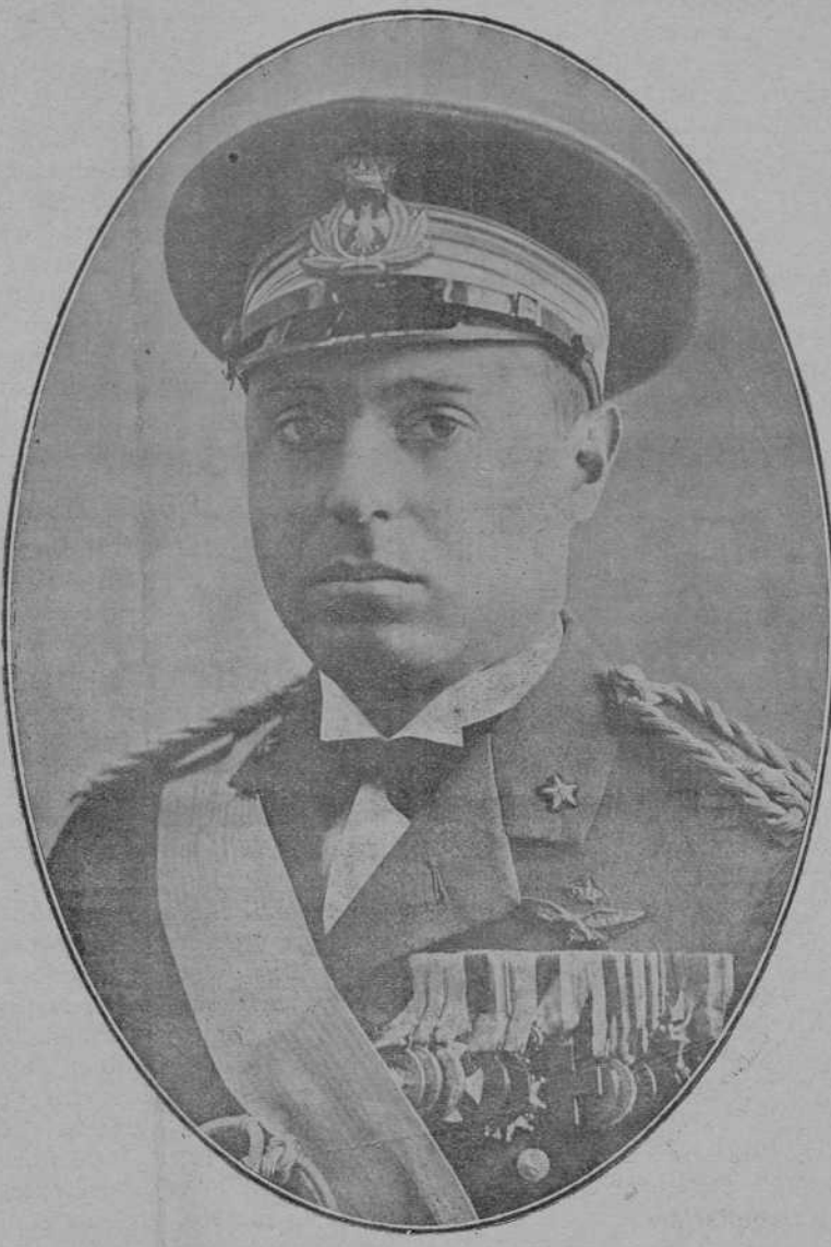
El insigne aviador italiano marqués de Pinedo, primer "as" de la aviación mundial, que hoy ha llegado a esta corte, en la penúltima etapa de su viaje de retorno alrededor del mundo.