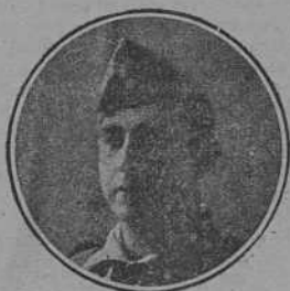
Don Francisco G. Escames Comandante de la Legión, propuesto para una recompensa por el Mando francés por su cooperación al avance de las tropas de aquel país