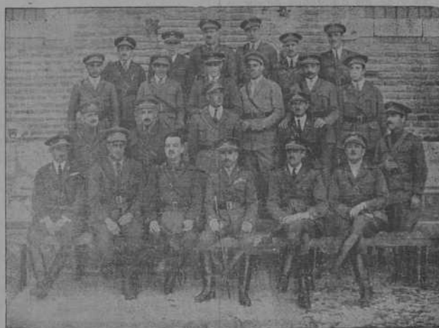
Grupo de jefes y oficiales del 14 Regimiento de Artillería ligera