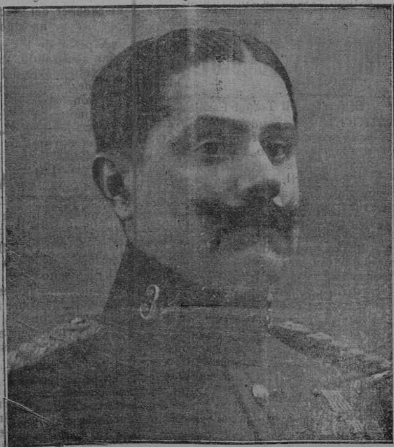
El excelentísimo señor don José Saro, general de división, jefe de las fuerzas que desembarcaron en Alhucemas, a quien, por sus brillantes servicios militares, le ha sido concedido por el Rey el título de conde de la Playa de Esadain.