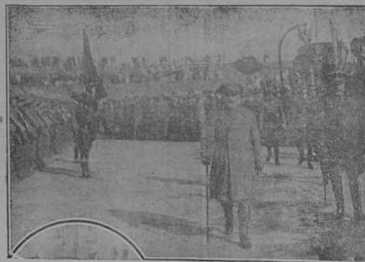
El comandante general de Melilla, general Castro Girona, revistando la guarnición.