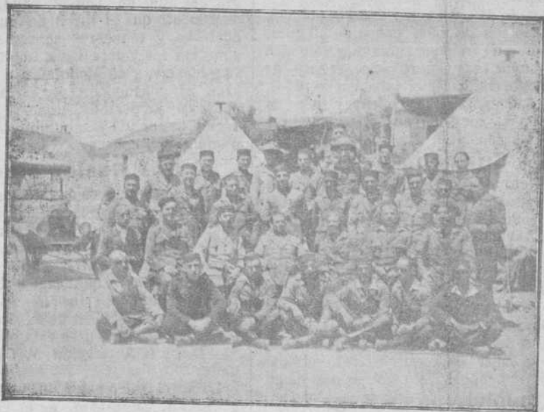
El Regimiento de Africa número 68.—Grupo de jefes y oficiales