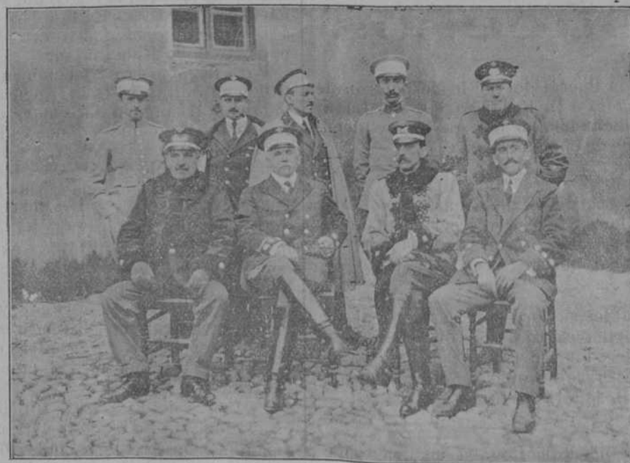
Coronel, jefes y oficiales del 6.º depósito de sementales

Se ruega a los señores vocales la puntual asistencia a dicha reunión, que se celebrará en el domicilio social, calle de Zurbano, número 8.