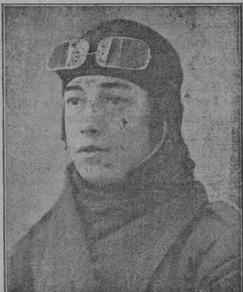
El capitán Zubia.

BARCELONA 5.—En breve saldrán para Madrid, con objeto de visitar al jefe del Gobierno y asistir á la Asamblea de la constitución del Montepío marítimo, los representantes de las Agrupaciones marítimas.